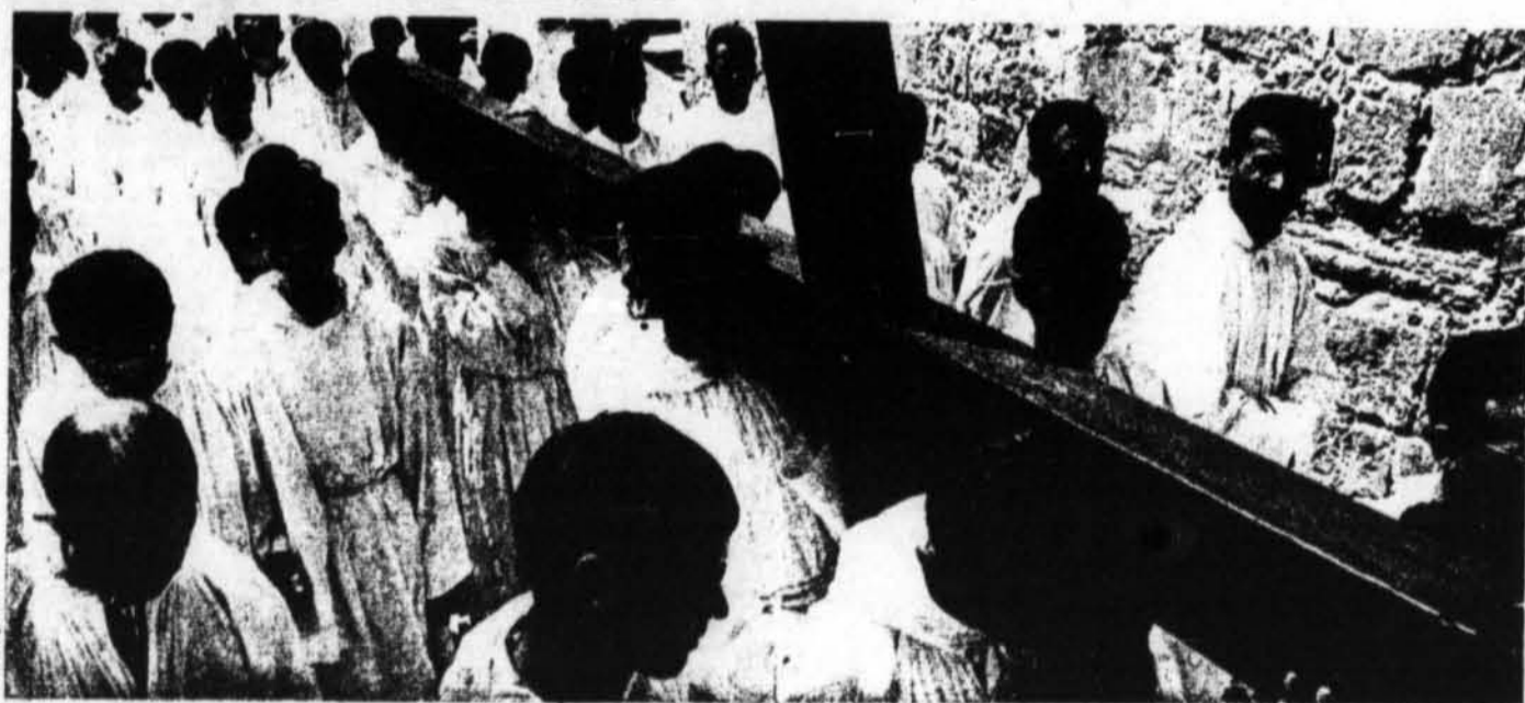
La croix signe du salut. A Jérusalem, un chemin de croix solennel.

Pour tout homme qui pense, le temps de la Passion est pénible et tracassant. Ces souffrances et cette mort sont maintenant si loin, cette histoire est si cruelle, qu'on préférerait tout simplement l'oublier. Pourquoi revenir sur ce triste spectacle, chaque année, avant la joie de Pâques?