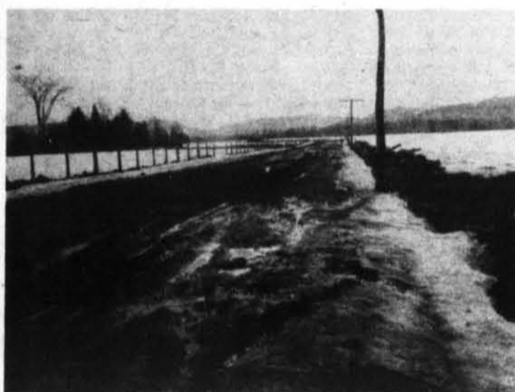
Photo prise sur les routes du Nord, entre St-André-Avellin et N.-Dame de la Paix. Cette route est bloquée et cela en 1969. Qu'attend le Département de la Voirie pour remédier à la situation.