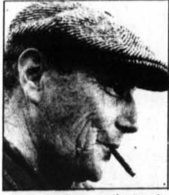
«L'Envers des hommes» présentera des pêcheurs marseillais, à 22 h 30.