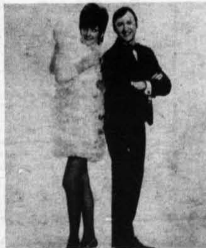
Chanteurs / Comédiens