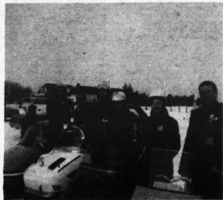
Photo des gagnants de la course d'autos-neige tenue récemment à Notre-Dame de la Paix, M. G. Poulin représentant la Brasse-rie Dow-O'Keefe, remettait les trophées aux gagnants.