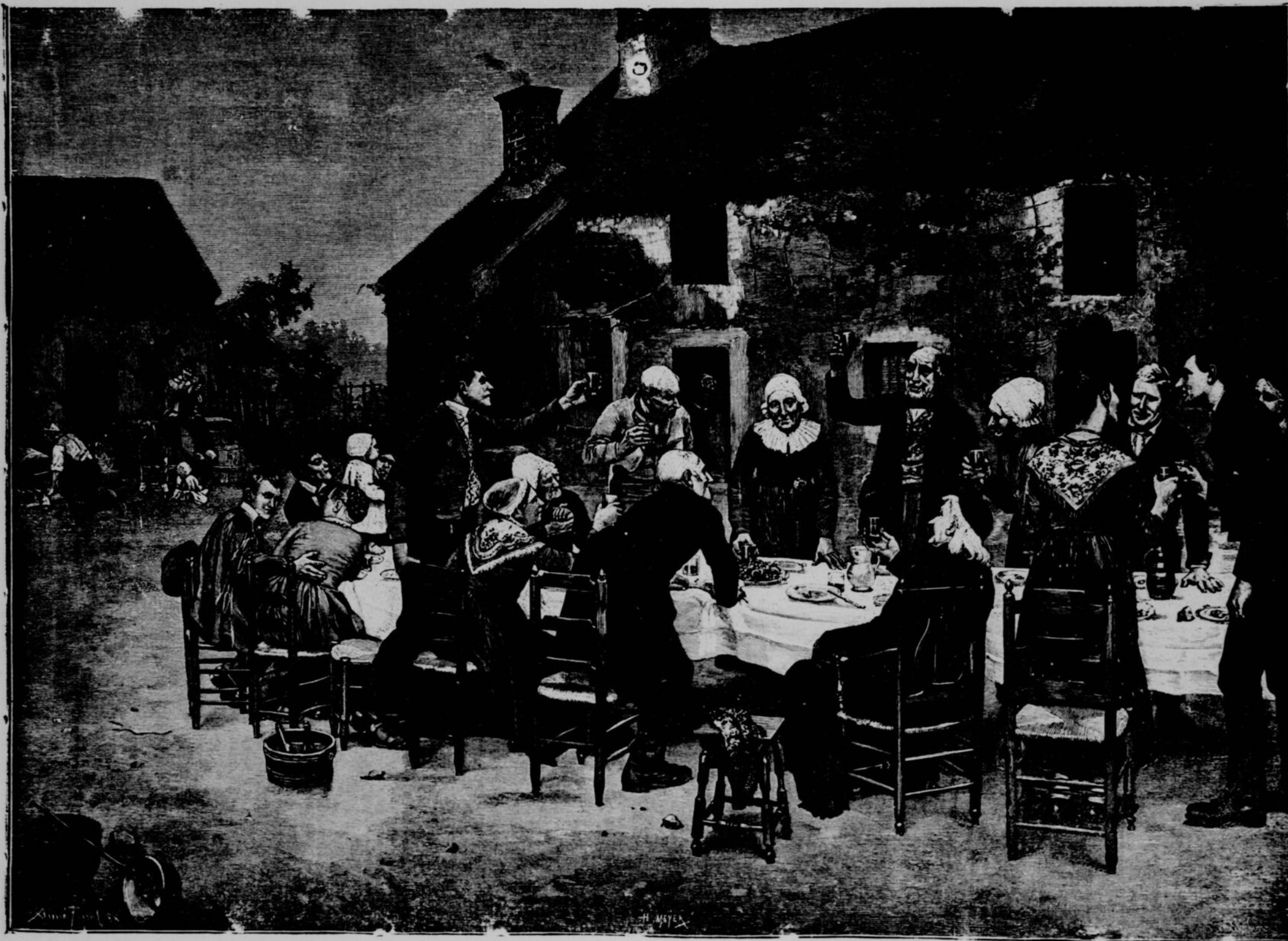
SALON DE 1888. — LA CINQUANTAINE : LES NOCES D'OR AU VILLAGE. — TABLEAU DE M. AIMÉ PERRET