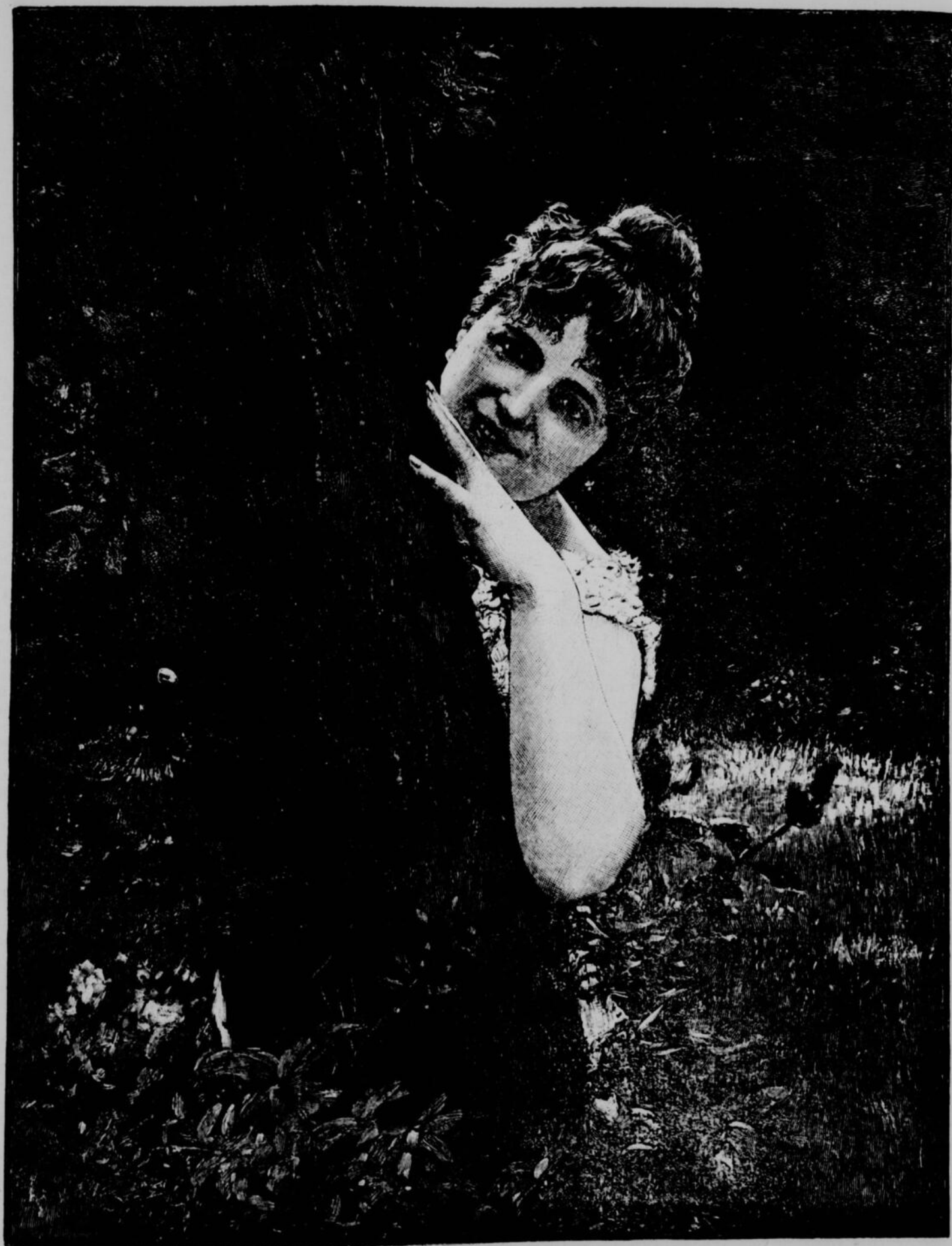
BÉBÉ ! BÉBÉ ! M'ENTENDS-TU ?

La ligne, par insertion . . . . . 10 cents Insertions subséquentes . . . . . 5 cents Tarif special pour annonces à long terme