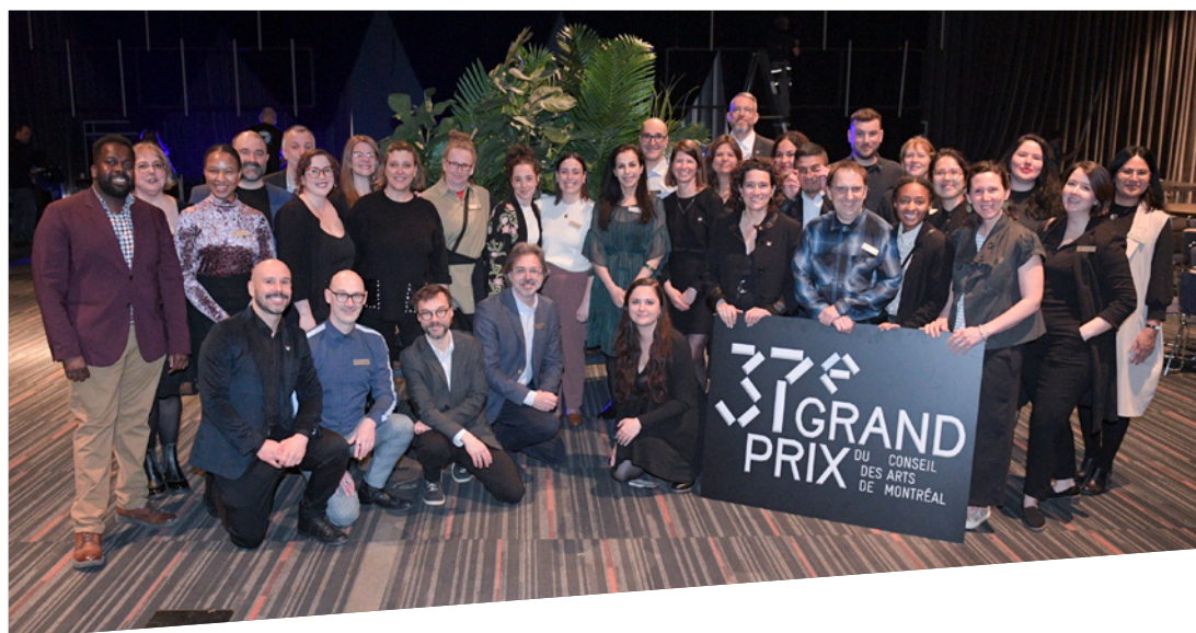
L'équipe du CAM