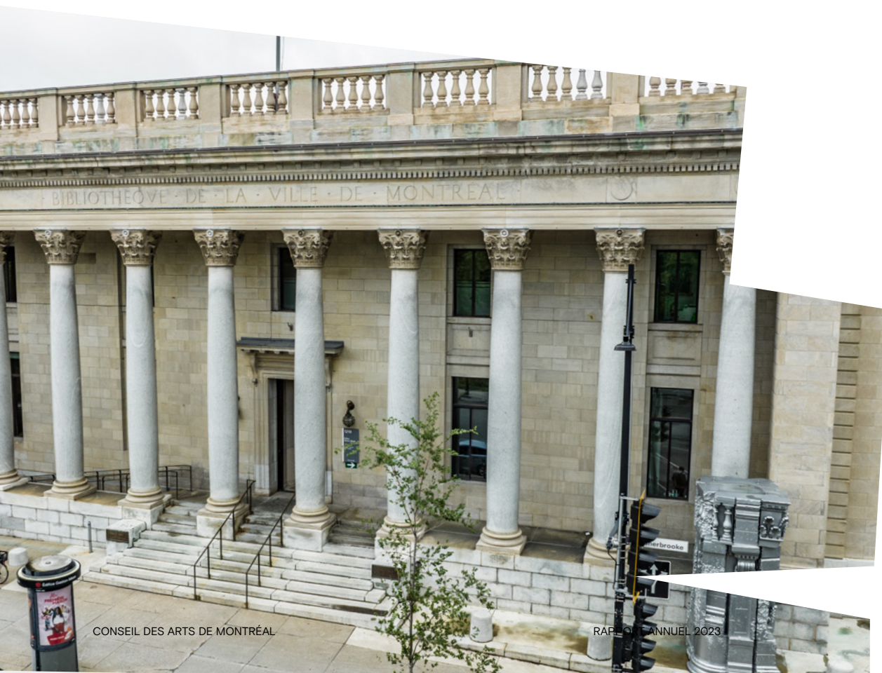
La Maison du Conseil des arts de Montréal Crédit : Hugues Bouchard