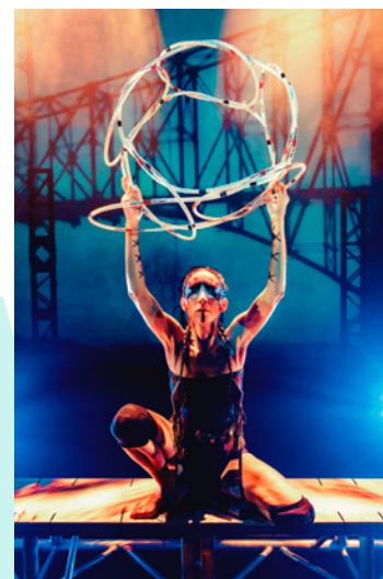
Danseurs du ciel Danse Théâtre A'no'wara Barbara Kanerattoni Diabo