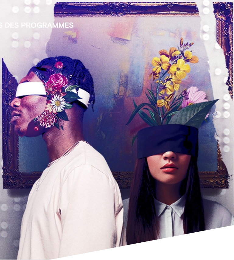
Braille - L'art au delà du visuel, une exposition présentée par l'organisme WECAN