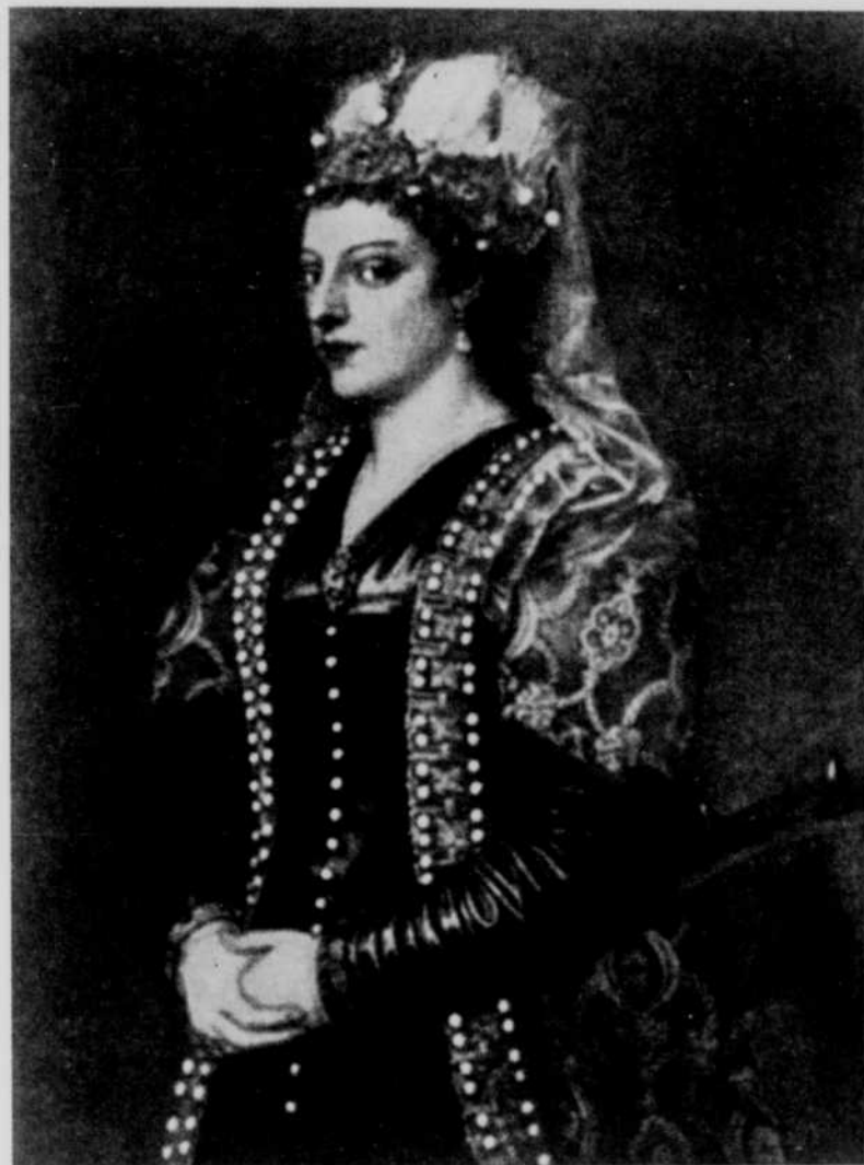
Portrait de Caterina Cornaro (Titien)

C'est Florent Forget, coordonnateur du Théâtre populaire, qui assumera la réalisation de cette oeuvre.