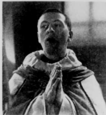
Notre couverture: "Vigile pascale à St-Benoît-du-Lac" que l'on verra à la télévision, samedi 5 avril, à 6 h. 45.

Le 9 avril, de 8 h. 30 à 10 heures du soir, le réseau français de Radio-Canada diffusera, à l'émission Festival du mercredi , un concert donné à