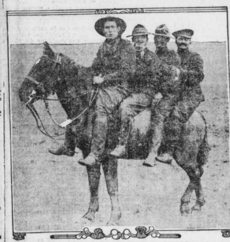
LES CANADIENS RECENTMENT DEBARQUES EN FRANCE et qui sont sur la ligne de feu soit en Belgique, soit dans les Dardennes, sont de ceux qu'on appelle de "gais lurons".—Comme on le voit ici par cette photographie prise en France, ils n'ont pas la mélancoie. Et le cheval paraît heureux de porter les quatre braves.

L'ennemi tente vainement une attaque sur la colline de Notre-Dame de Lorette.—En Argonne il est repoussé sur tous les points.