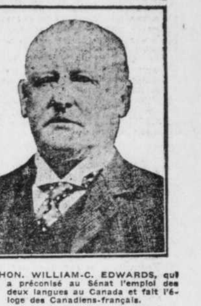
L'HON. WILLIAM C. EDWARDS, qui a préconisé au sénat l'emploi des deux langues au Canada et fait l'éloge des Canadiens-français.

Ottawa, 17. — Le sénateur Edwards a repris, hier, au sénat, le débat au sujet de la motion du sénateur David touchant les écoles bilingues. Il touche à cette question avec quelque crainte. Cette question ouvre la porte à de longues controverses et devrait en conséquence être traitée d'une manière modérée et judicieuse. Elle est aussi délicate et intéressante une large proportion de la population canadienne ne se sent pas en fait une question de parti et s'il croyait qu'on en a voulu faire une question de parti il ne prendrait pas part au débat, car il croit qu'on ne devrait pas discuter de question de parti au sénat. La presse du pays a discuté cette controverse et le sénateur lit un article de rédaction bilingue sur le sujet. Le sénateur Edwards déclare qu'il se sent pas sûr de dire que sir Wilfrid Laurier pour avoir permis à sir Lomer Gouin et au sénateur David, de présenter des résolutions à ce sujet. Le sénateur Edwards déclare qu'il se sent pas sûr de dire que sir Wilfrid Laurier pour avoir permis à sir Lomer Gouin et au sénateur David, de présenter des résolutions à ce sujet.