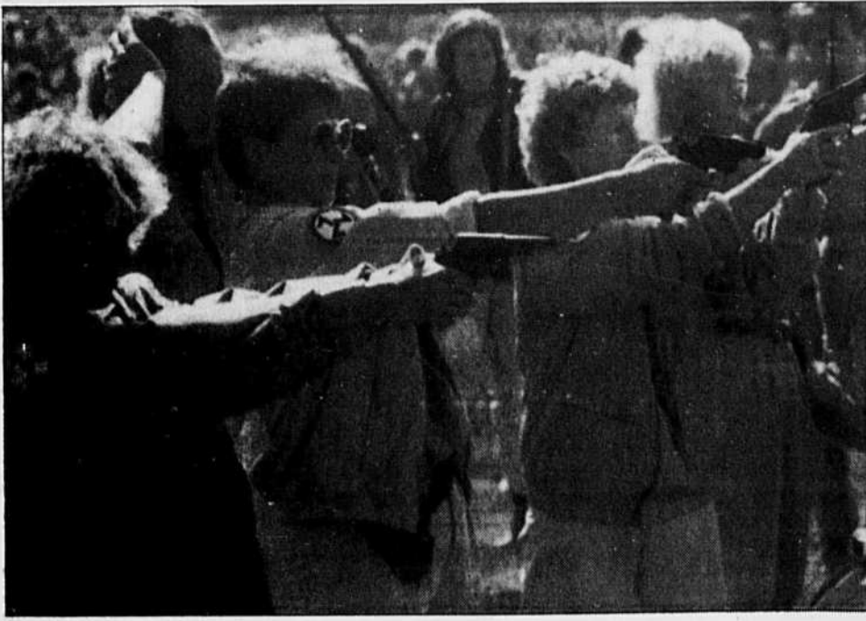
Le mouvement de résistance afrikaner : des accointances avec les forces armées régulières ?