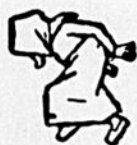
Les propos d'Elidore

N.-B.—Ces terrains, que vous pouvez au- jourd'hui vous procurer à des conditions in- crovables de bon marché, prendront prochai- nement une plus-value considérable. Hâtez- vous d'en acquérir: vous avez là un moyen sûr de doubler votre argent d'ici quelques mois.