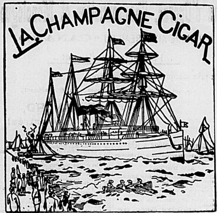
PETIT DUC LA FINE CHAMPAGNE, LA CHAMPAGNE R. V. O. "Ourling Cigar," fait à la main valeur 10¢ pour 5¢.

Le Marchand de Meubles reconnu pour vendre aux prix les plus bas. 1551 Ste-Catherine Magasin 1447-1449 do Nouveau Magasin