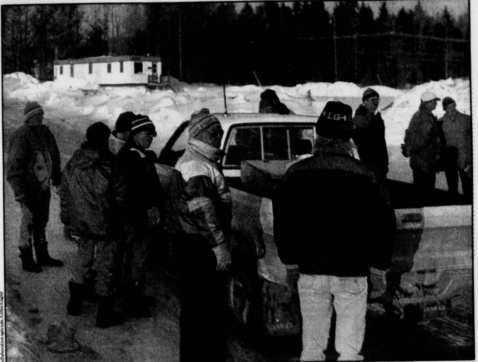
Une partie des travailleurs vérifie l'identité des ouvriers entrant sur le chantier de construction de la nouvelle scierie de Lac-au-Saumon, dans la Matapédia.

« Il y a des travailleurs de la construction sur le bien-être social parce qu'il n'y a pas d'ouvrage. La déréglementation dans le secteur