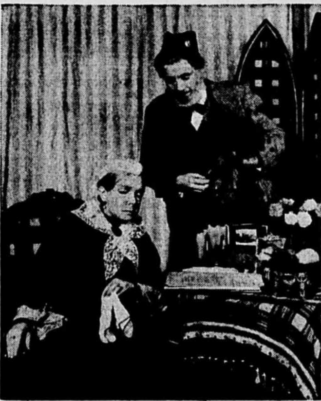
Une des dernières scènes de "Victoria Regina" (texte original anglais) qui se jouera la semaine prochaine.