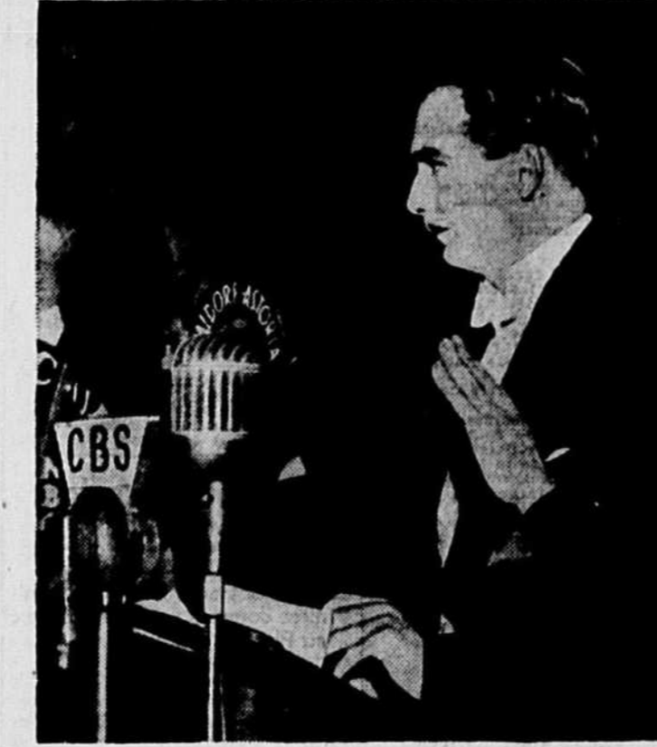
Le capitaine Anthony Eden, ancien secrétaire des Affaires étrangères dans le cabinet britannique, prononce un discours devant les membres de l'Association nationale des Manufacturiers américains, lors du banquet annuel de cette organisation, qui eut lieu à l'hôtel Waldorf-Astoria, à New-York, il y a quelque temps. Cette allocution de l'éminent homme d'Etat anglais marqua l'inauguration en public du nouveau microphone "cardiode" de la Northern Electric, créé récemment dans les laboratoires de la Compagnie de Téléphone Bell. Cet ingénieux instrument, grâce à ses caractéristiques exceptionnelles, permet aux ingénieurs de choisir les sons dans la direction qu'ils veulent et de supprimer en même temps les bruits qu'ils ne désirent pas transmettre.