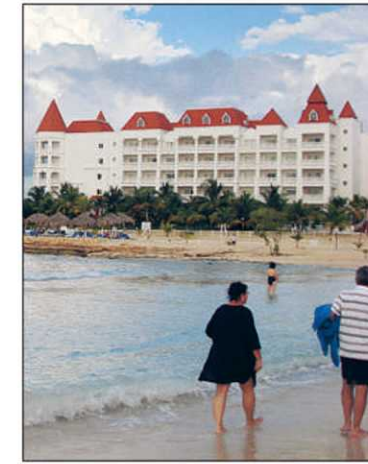
À gauche, le Grand Bahia Principe de Runaway Bay, où l'eau peu profonde est idéale pour la baignade avec les enfants; à droite, le Sandals Whitehouse, qui donne des envies de famine.

Marie-Julie Gagnon (collaboration spéciale)