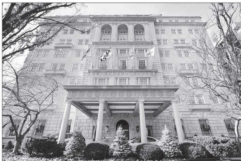
Selon la légende, le Hay-Adams est hanté par la femme de l'écrivain Henry Adams (descendant des présidents John et Quincy Adams), qui s'est suicidée en 1885.