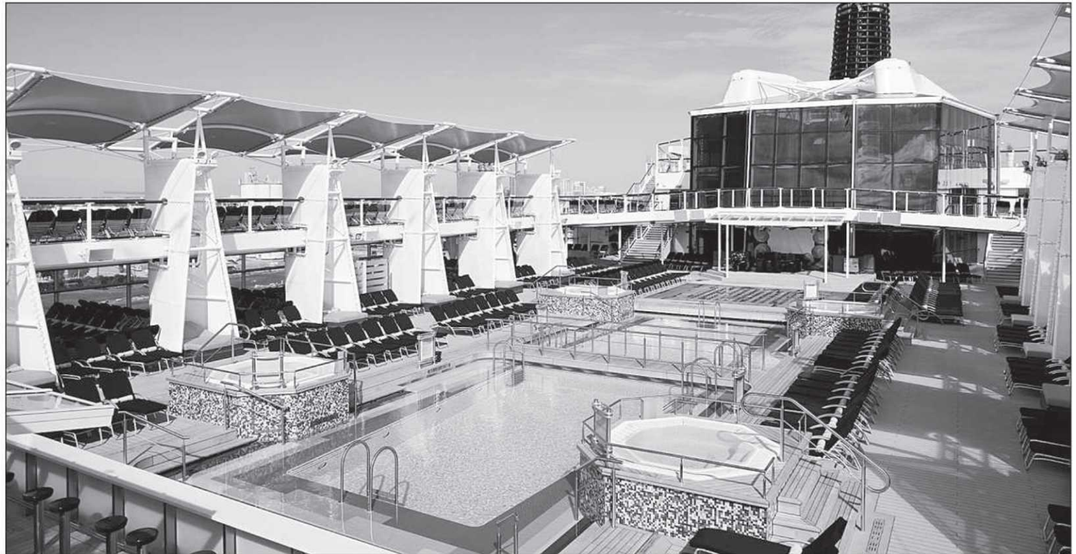
Le nouveau navire de Celebrity Cruises, le Solstice

Tellement à l'aise que le Québec est aujourd'hui la province