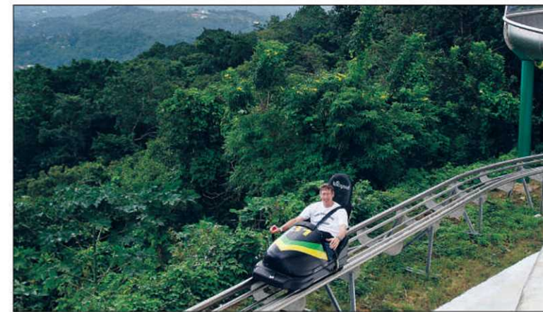
Les bobsleighs de Mystic Mountain sont conçus pour une personne.

Fier de sa réalisation, le fondateur et directeur général ne lésine pas sur les détails concernant les études, la construction et la réalisation du projet, qui s'est fait dans