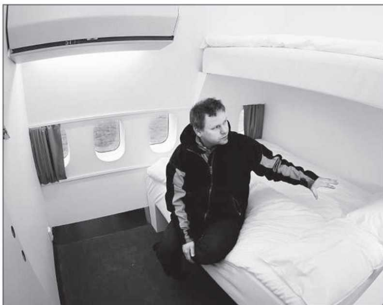
Tout est fait pour rappeler au client du Jumbo Hostel qu'il est dans un avion.

Les chambres de six mètres carrés sont équipées de façon spartiate, avec une couchette, un compartiment à bagages au-dessus du lit et une télévision à écran plat qui diffuse aussi bien des di-