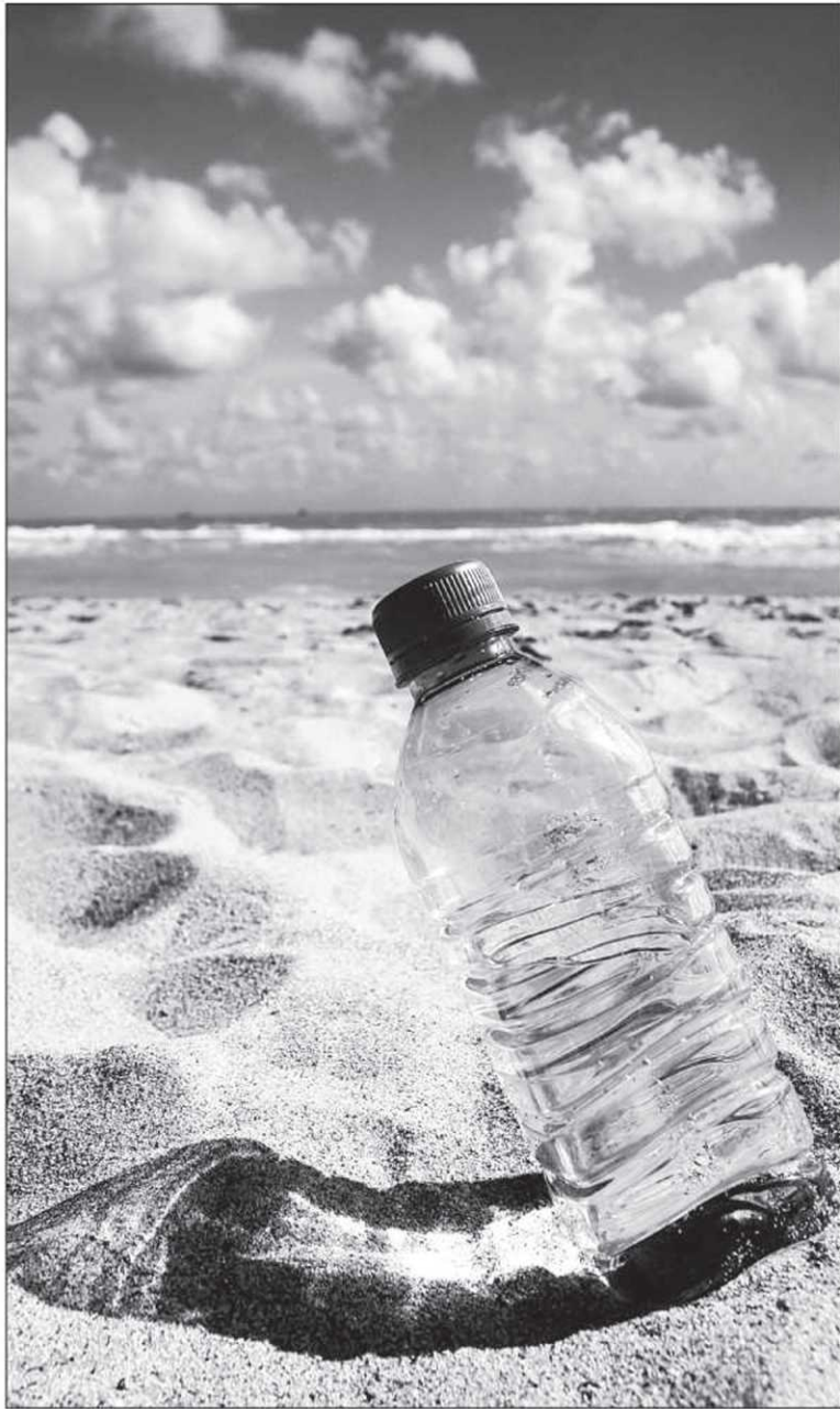
Les malaises de l'estomac et de l'intestin sont souvent contractés dans la nourriture contaminée, dans l'eau ou par contact avec des mains ou un objet souillés.

constituent un réservoir de transmission important et peuvent la transmettre facilement par leurs selles. La période d'incubation varie de 10 à 50 jours. L'eau et les aliments contaminés (mollusques et crustacés en particulier) sont des sources de transmission importantes et même parfois le sang.