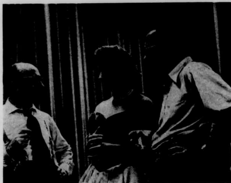
RAY BLOCH, RISE STEVENS et ED SULLIVAN préparent la prochaine émission de Toast of the Town .