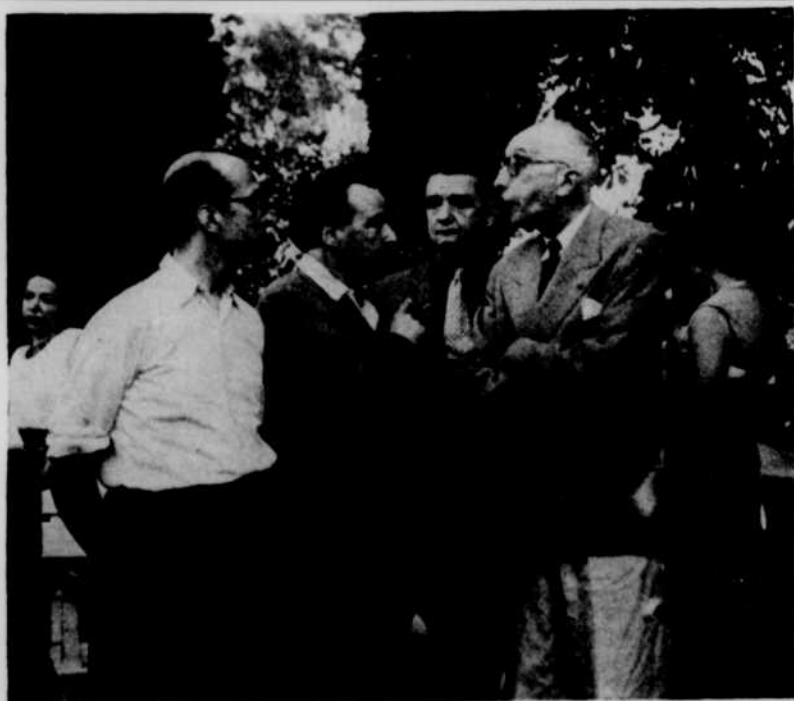
Les festivals de musique en Europe sont souvent le lieu de rencontres imprévues de célébrités dans tous les domaines. Par exemple, l'exceptionnelle photo ci-dessus a été prise au dernier Festival d'Aix-en-Provence. On remarque, de gauche à droite, DANIEL-LESUR, ARTHUR HONEGGER et GEORGES AURIC, trois compositeurs français bien connus, causant avec le romancier FRANÇOIS MAURIAC. Rappelons que la Cinquième Symphonie d'Honegger sera entendue dimanche, à 3 heures, au réseau Français, à l'émission Festivals de France.

Né à Skien en 1828, Henrik Ibsen a écrit plusieurs pièces remarquables, à tendances philosophiques et sociales. Parmi les plus célèbres, mentionnons Maison de poupée et Le canard sauvage .