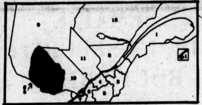
La Région Agricole No. 8