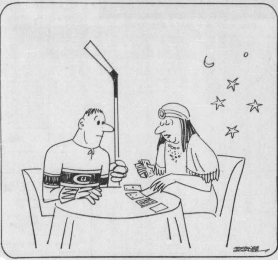
"Vous allez déménager en 1966..."