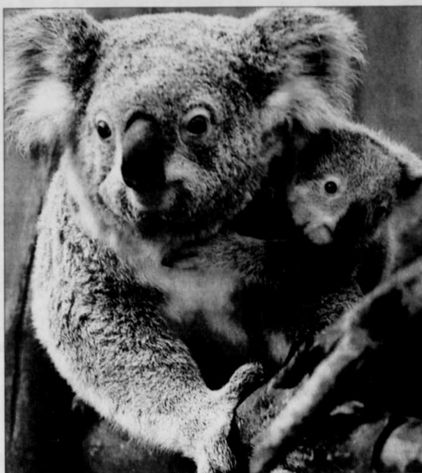
Le koala donne naissance à un seul petit par portée, puis le nouveau-né passe plusieurs mois dans la poche marsupiale. Il passe la grande majorité de ses journées à dormir dans les arbres et se nourrit la nuit.