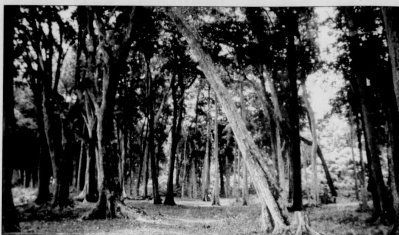
La forêt tropicale à deux pas de la plage Radhanagar, sur l'île de Havelock