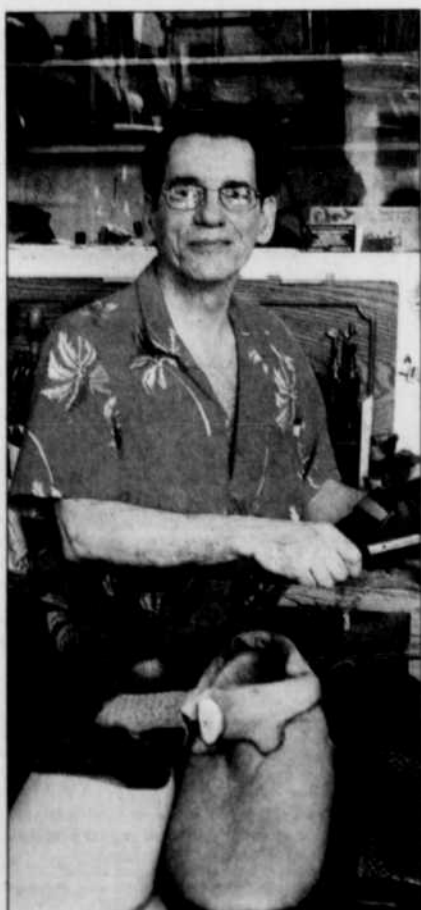
Au long d'un des parcours, on rencontre un artisan du cuir.

Ces visites s'inspirent du learning travel , un concept américain apparu il y a quelques années pour satisfaire aux demandes et aux intérêts particuliers d'une certaine clientèle. S'enrichir de nouvelles expériences en voyageant et en apprenant, telle pourrait être la définition du learning travel . Ces visites s'adressent à des groupes, qu'ils soient congressistes, gens d'affaires, touristes, étudiants ou autres... Neuf grands thèmes y sont abordés : les plaisirs gourmands, l'histoire, les trésors artistiques, le magasinage, l'architecture, le patrimoine religieux, Montréal en bleu, Montréal en vert et, bien sûr, le multiculturalisme. Alors, si vous êtes un passionné de cuisine et de gastronomie, vous choisirez le circuit des plaisirs gourmands. Ou si vous aimez l'architecture, vous opterez pour Visions architecturales.