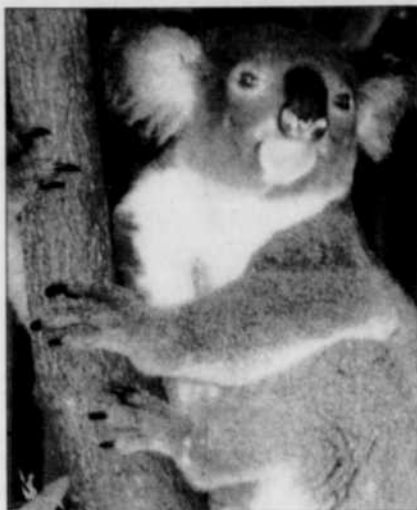
Si leur survie est menacée sur le continent, le nombre de koalas a explosé sur l'île des Kangourous, au large de la côte sud de l'Australie.

CANBERRA, Australie (AP) — D'ici 12 ans, les koalas auront probablement disparu de la côte est de l'Australie, en raison de la prolifération de l'urbanisme et de l'agriculture. C'est le signal d'alarme lancé par la Fondation australienne du koala, qui souhaite que ce marsupial soit inscrit sur la liste des espèces vulnérables.