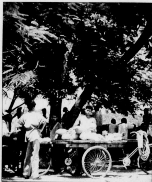
Un vendeur de noix de coco dans le petit port de Havelock. On coupe le haut de la noix pour boire l'eau de coco et ensuite manger la chair fraîche à l'intérieur.

Après quelques jours aux îles, on a envie de s'oublier sur les plages tant le rythme y est calme et le coût de la vie doux pour le portefeuille: mais la durée du séjour est limitée à 30 jours... Alors on repart avec l'envie de revenir dans ce petit coin de paradis bien gardé.