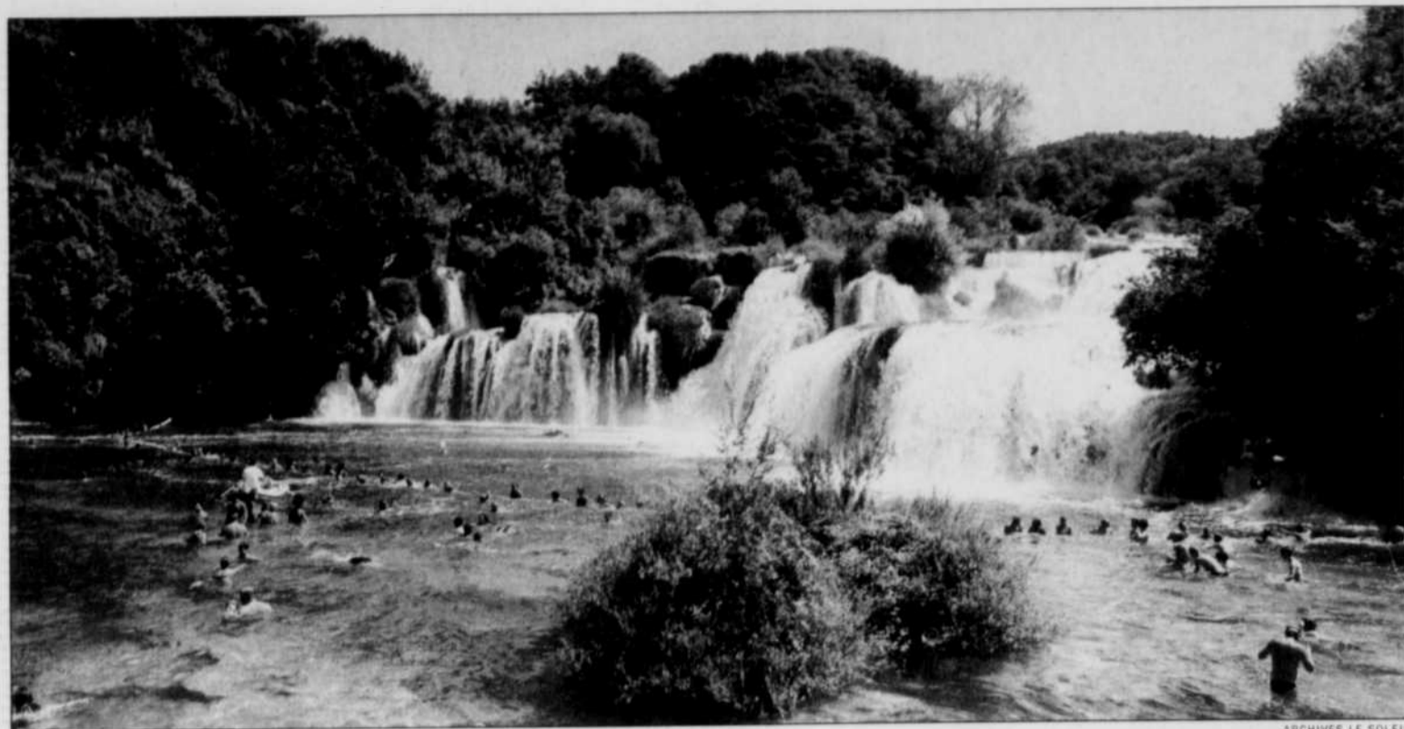
Les îles de l'archipel de Sibenik sont les « bijoux de l'Adriatique, un patrimoine d'une valeur inestimable », a déclaré le ministre croate du Tourisme.