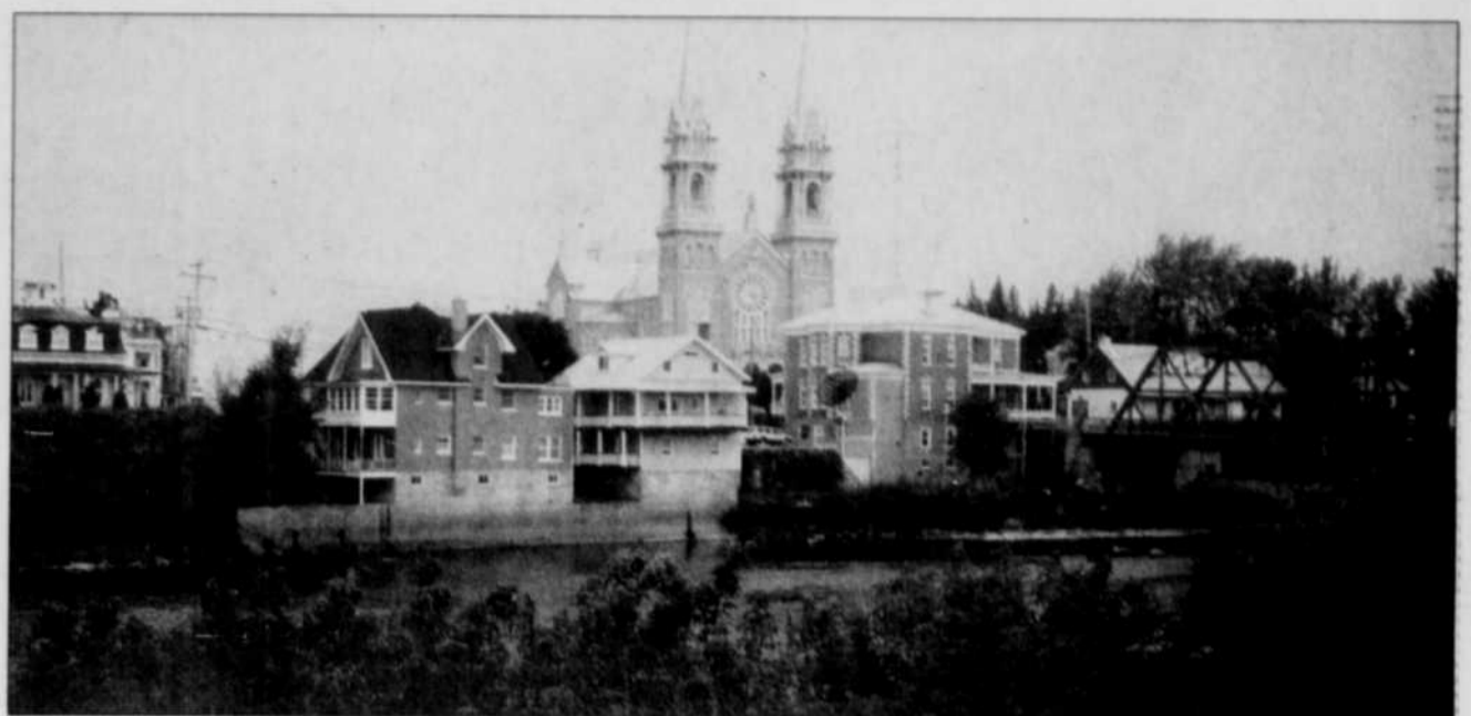
Une magnifique église de style gothique trône au centre du village de Saint-Casimir, qui compte quelque 1600 habitants.

On a lancé la saison la fin de semaine dernière. Toutes les chambres sont très propres... comme dans un couvent. L'ameublement a été récupéré en grande partie du motel Le Rond Point de Lévis, dont on achève la démolition. Les lits, les téléviseurs, les lavabos et les cabinets d'aisance — qui ne sont pas encore tous installés — voire même les 35 portes des 35 chambres du... couvent. Le réfectoire ressemble maintenant à une véritable salle à manger avec des tables et des chaises aussi lévisiennes que le reste. Même la chapelle, transformée en salle de spectacle, peut aussi servir de salle de réunion.