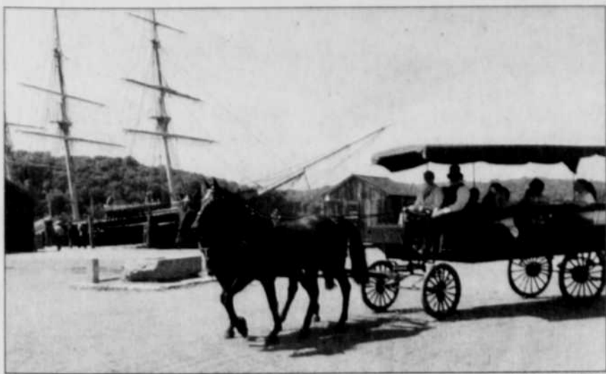
Les visiteurs du musée maritime de Mystic Seaport peuvent profiter d'une promenade en calèche.