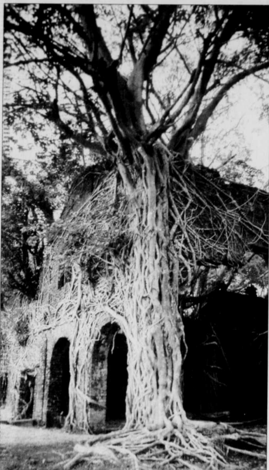
Vestiges des quartiers généraux des Britanniques sur l'île de Ross, à quelques kilomètres de Port Blair.