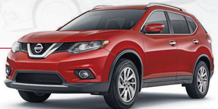
Rogue SL illustré avec Ensemble Privilège**