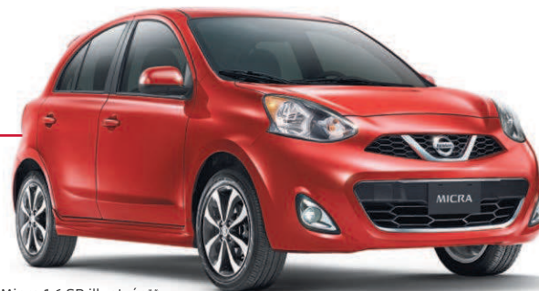
Micra 1.6 SR illustrée**