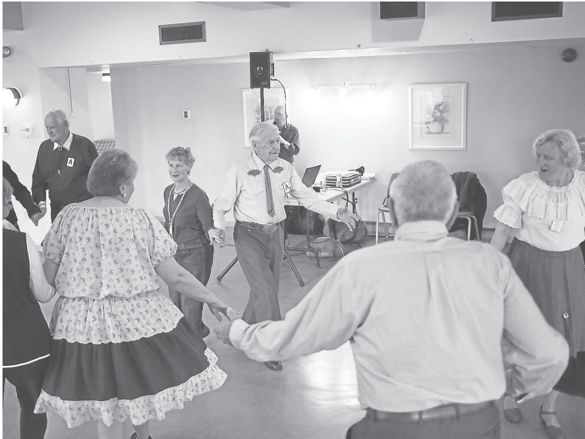
Les membres des Brome Squares se donnent rendez-vous au club de l'Âge d'or de Cowansville, rue Principale, pour effectuer quelques pas au rythme de la square dance à l'américaine.