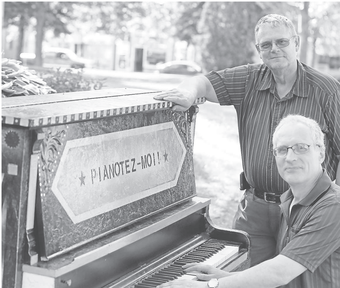
Comme dans le temps de leurs études au Mont-Sacré-Cœur, les deux musiciens se sont laissés aller à leur passion: la musique.

en temps », raconte Jocelyn, assis près de son piano public fétiche.