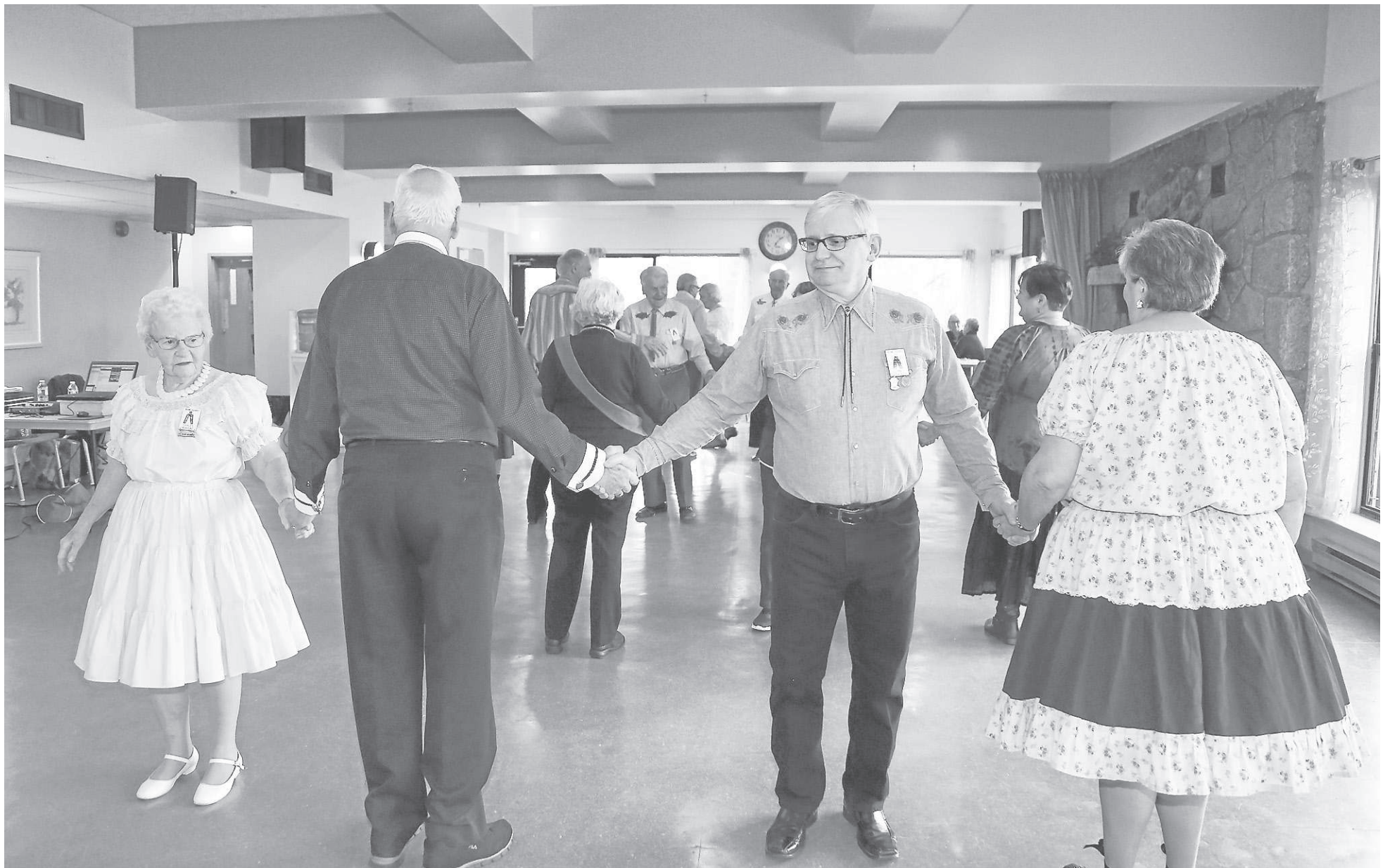
Les aînés se rencontrent tous les mardis pour danser en ligne.

Et à voir les sourires fendus jusqu'aux oreilles des gens présents, on voit que c'est bel et bien vrai.