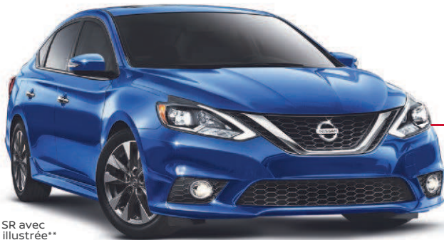
Sentra 1.8 SR avec boîte CVT illustrée**