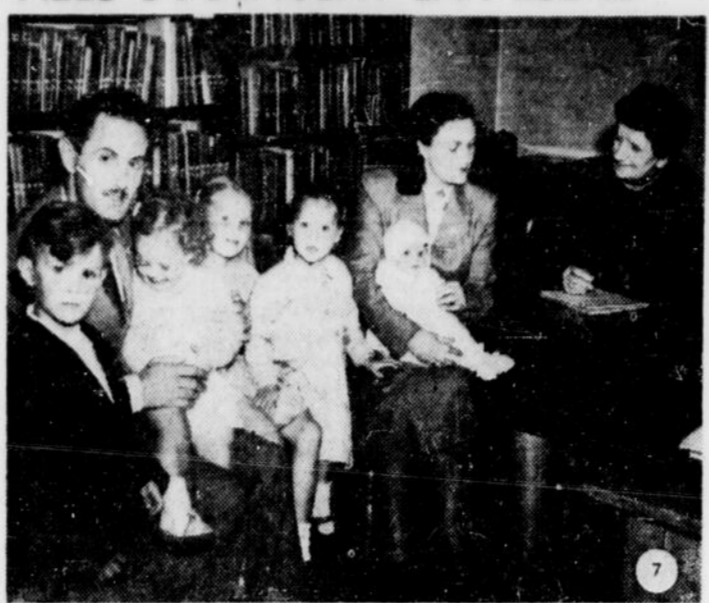
Cette famille yougoslave a trouvé un logement au Canada grâce au Bureau Catholique d'Immigration de Vancouver. La générosité des Canadiens a permis à des milliers d'infortunés "réfugiés" ou "expulsés" de refaire leur vie au Canada. La collecte "des Charités papales" est destinée à venir en aide aux victimes des inondations de l'Italie méridionale, insulaire, et septentrionale, produisant toute espèce d'assistance matérielle et morale. Prêtres, religieux, missionnaires et assistants sociaux ont collaboré à cette oeuvre avec un grand

Ottawa, 31 (IN) Les calamités publiques qui surviennent un peu partout dans le monde suscitent chaque fois une intervention de la générosité papale. Qu'il s'agisse des inondations de Hollande ou de Belgique, d'Angleterre ou d'Italie, des victimes d'un typhon qui ravage les Philippines, qu'il s'agisse des victimes de l'inondation survenue dans le diocèse de Tabasco, au Mexique ou des sinistrés du conflit de l'Indo-