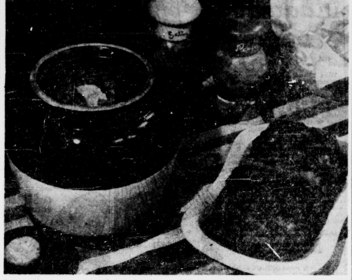
Rien ne remplace le pot de grés pour les fèves au lard qui doivent leur goût succulent à leur long séjour au fourneau. Si vous avez des invités étrangers, vous pouvez les convier à un repas typiquement canadien qui comprendra, en plus de nos fèves nationales, un gâteau éponge généreusement arrosé de sirop d'érable.