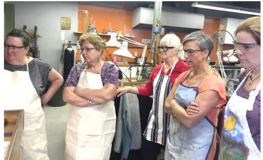
Journée d'initiation à la joaillerie du 29 mai 2016 à École de Joaillerie de Montréal.

Qu'il soit de nature financière, culturelle, artistique ou associative, le partenariat s'avère une solution gagnante.