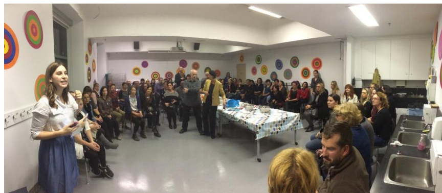
Rencontre régionale 2016 au Musée d'art contemporain de Montréal

L'association se donne des moyens pour entendre les opinions des enseignants et en faire la promotion. En dotant le site Web de l'AQÉSAP d'un volet nommé « plaidoyer de l'enseignement des arts au Québec » il sera possible aux enseignants de se faire entendre. De plus, le site web de la revue Vision pourra accueillir aussi les commentaires des enseignants sous forme de blog afin qu'ils puissent soumettre librement leurs arguments en lien avec la situation de l'enseignement des arts plastiques au Québec.