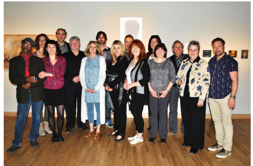
Exposition des membres 2016