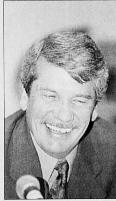
ARCHIVES LE DEVOIR