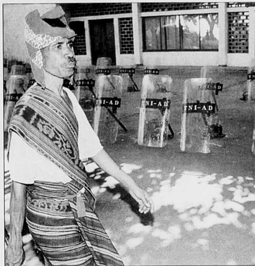
Calme plat hier dans les rues de Dili: les manifestations annoncées par les indépendantistes est-timorais n'ont pas eu lieu.

Pour certains journaux britanniques, Tony Blair a fait un dangereux pari en offrant la décentralisation aux Écossais, beaucoup d'entre eux considérant leur futur parlement comme un premier pas vers la séparation du reste du Royaume.