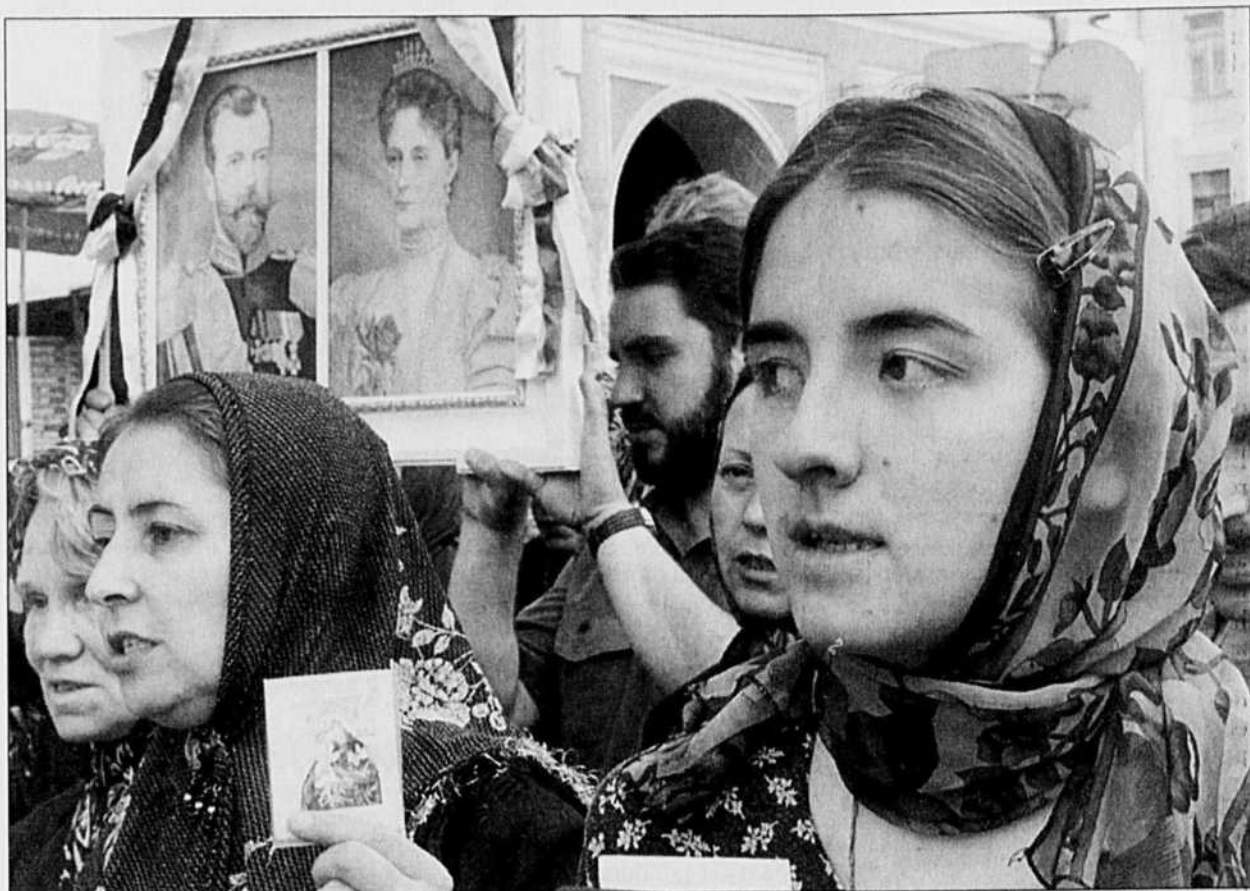
Dans les rues de Saint-Petersbourg, des Russes ont commémoré hier la mort, survenue il y a 80 ans jour pour jour, de la famille impériale en tenant des icônes et des portraits de Nicolas II et son épouse Alexandra Fyodorovna. Pour des raisons de sécurité, l'accès à la forteresse Pierre et Paul avait été interdit au public, et réservé aux invités et aux journalistes. Le peuple s'est ainsi retrouvé exclu des cérémonies officielles.

Ceux qui, pendant des années, ont avalisé ce crime le sont