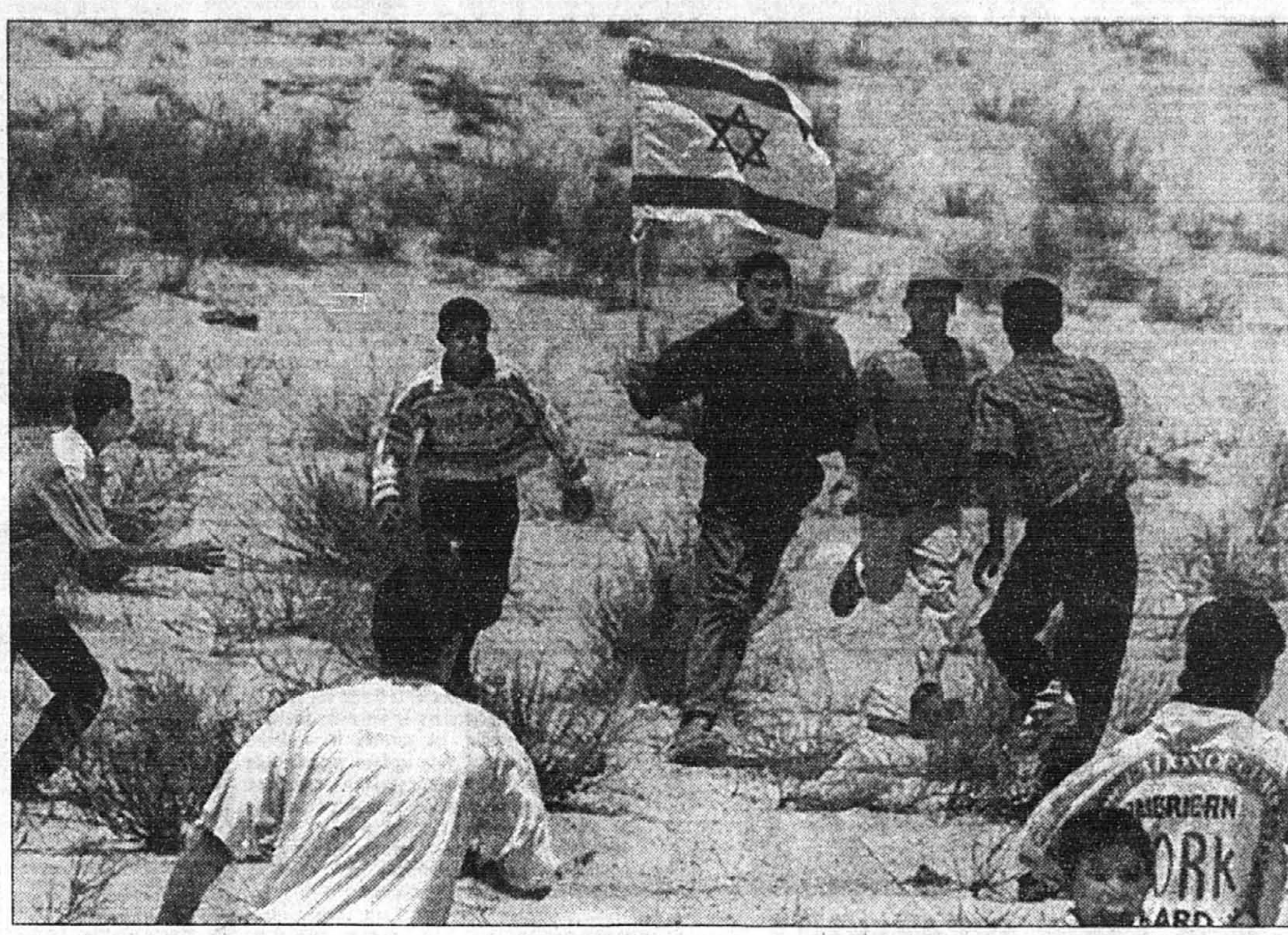
Un peu comme dans un grand jeu scout, ces jeunes Palestiniens courent de toutes leurs jambes avec leur trophée : le drapeau israélien d'une petite colonie juive implantée près de Morag dans la ville de Rafah — dans la partie sud de la bande de Gaza. Ils manifestaient leur opposition à l'agrandissement du territoire de la colonie juive en question.

À quelques jours de l'ouverture du « sommet des huit » à Denver, Bill Clinton a approuvé hier un important programme d'aide économique aux pays de l'Afrique sub-saharienne, a-t-on appris auprès de la Maison-Blanche. Le programme permettra notamment aux pays africains de bénéficier d'un accès accru de leurs produits au marché américain, offre la garantie américaine aux investissements dans la région et propose des réévaluations de dette.