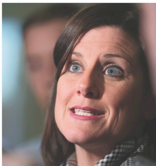
JACQUES BOISSINOT PC

« Des fois, on se dit "Ah, ça devrait être plus large" et tout ça. Il faut se rappeler où on en était il y a juste deux ans: des gens étaient très, très, très opposés à cette ouverture-là [à l'aide médicale à mourir], a affirmé M me Hivon, rappelant du même souffle que 22 députés de l'Assemblée nationale s'étaient opposés à l'adoption de la Loi sur les soins de fin de vie en avril 2014. « Aujourd'hui, on voit que notre loi sert d'inspiration réelle à tout le Canada. Et j'espère que toute la société québécoise est fière de ça, parce que c'est beaucoup, beaucoup de personnes qui se sont investies dans ce processus, dans ce vaste dé-