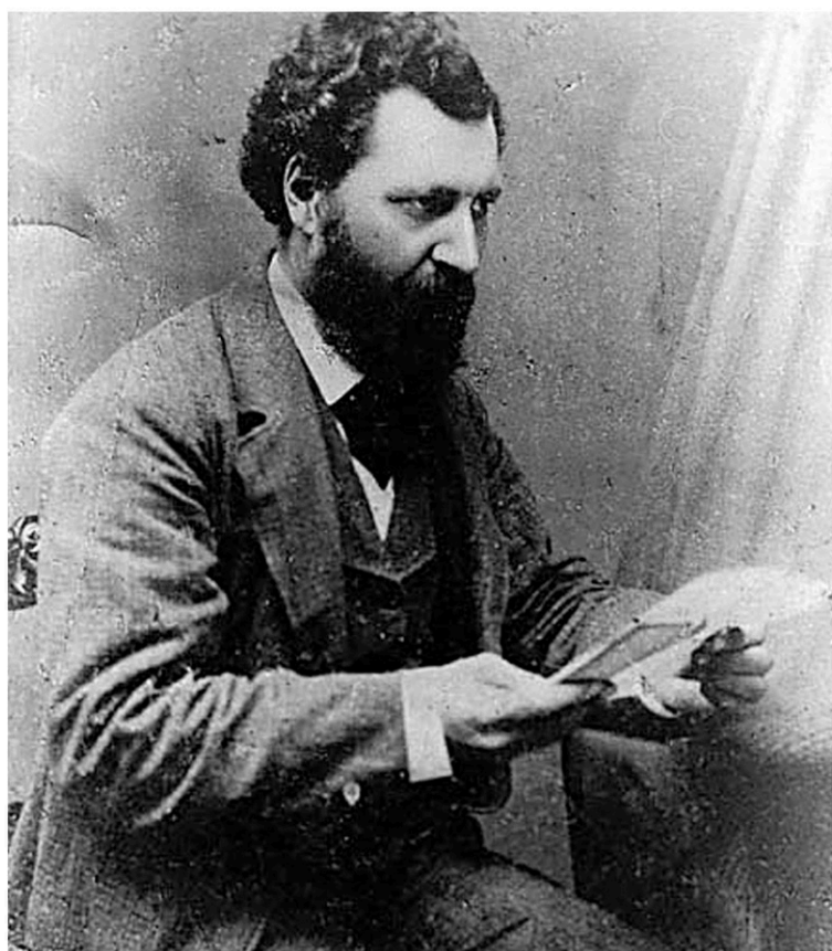
Louis Riel (ci-dessus en 1875) a mené l'insurrection métisse.

Lire aussi · Au Québec, la loi sur les soins de fin de vie survivra au projet de loi fédéral. Lisez les réactions politiques et un comparatif. Page A 3