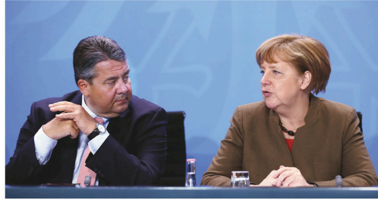
Angela Merkel (à droite) en compagnie du ministre de l'Économie, Sigmar Gabriel

Entre autres mesures, les autorités attribueront un lieu