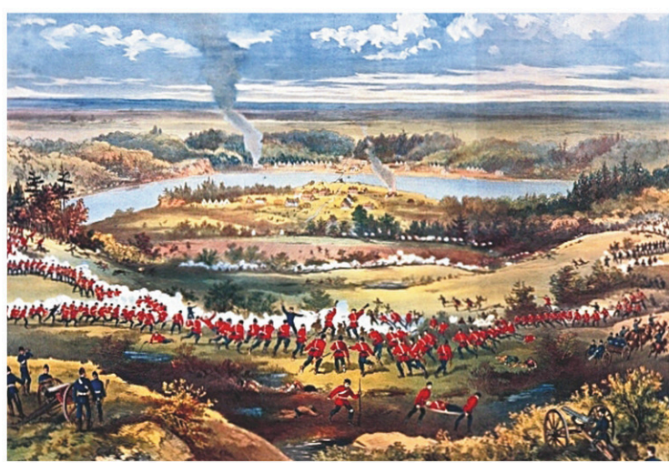
F. W. CURZON

À Montréal, le 65 e Bataillon est mobilisé. À Québec, on voit les soldats du 9 e Bataillon se mettre eux aussi en route pour les vastes plaines de l'Ouest. On part affronter Riel et son lieute-