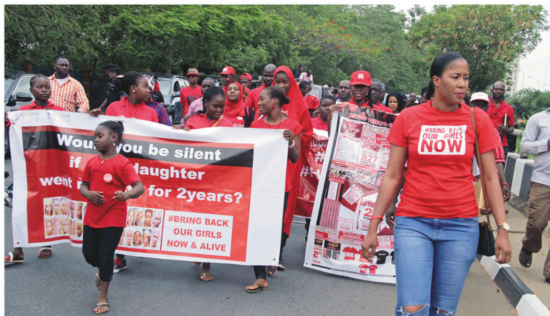
À Abuja, des manifestants ont réclamé la libération des jeunes filles enlevées il y a deux ans.