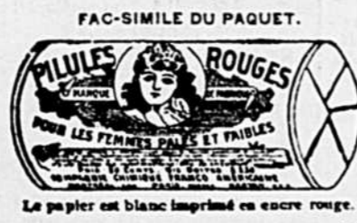
Fac-simile du paquet. Le papier est blanc imprimé en encre rouge.