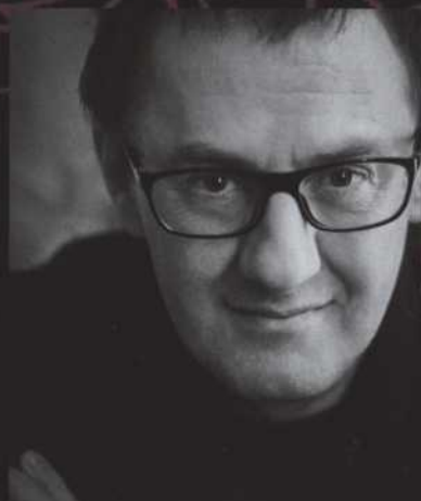
LIVRET, PAROLES ET MISE EN SCÈNE RENÉ RICHARD CYR