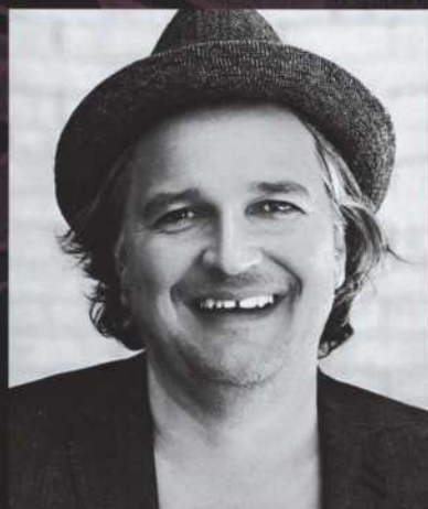
MUSIQUE DANIEL BÉLANGER