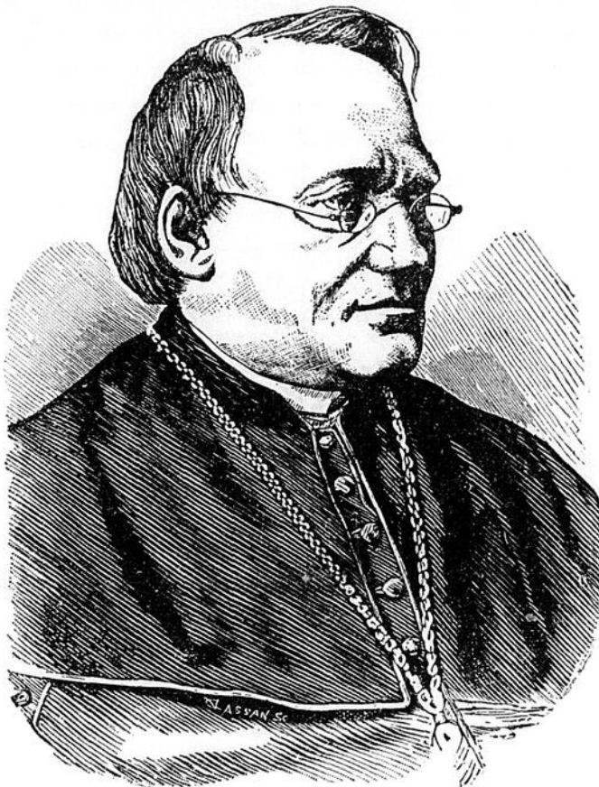
S. G. MGR. A. A. TACHÉ.

Sa Grandeur Monseigneur Alexandre-Antoine Taché, de la congrégation des Oblats de Marie-Immaculée, est né à Fraserville (Témiscouata), le 23 juillet 1823. Il fut ordonné prêtre le 12 octobre 1845; sacré évêque titulaire d'Arath et coadjuteur de St. Boniface, à Viviers (Ardèche, France), le 23 novembre 1851, puis devint évêque de Saint-Boniface le 7 juin 1853. Etant alors dans une mission lointaine du diocèse il ne prit possession solennelle de son évêché que le 5 novembre 1854; et devint premier archevêque le 22 septembre 1871, à l'érection du diocèse en métropole.