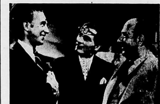
Le film musical "Je Chante", mettant en vedette le chanteur Charles Trenet, prend aujourd'hui l'affiche au Saint-Denis. On voit ici, de gauche à droite, Trenet, Jean Tissier et Félix Oudart dans une scène de ce film.