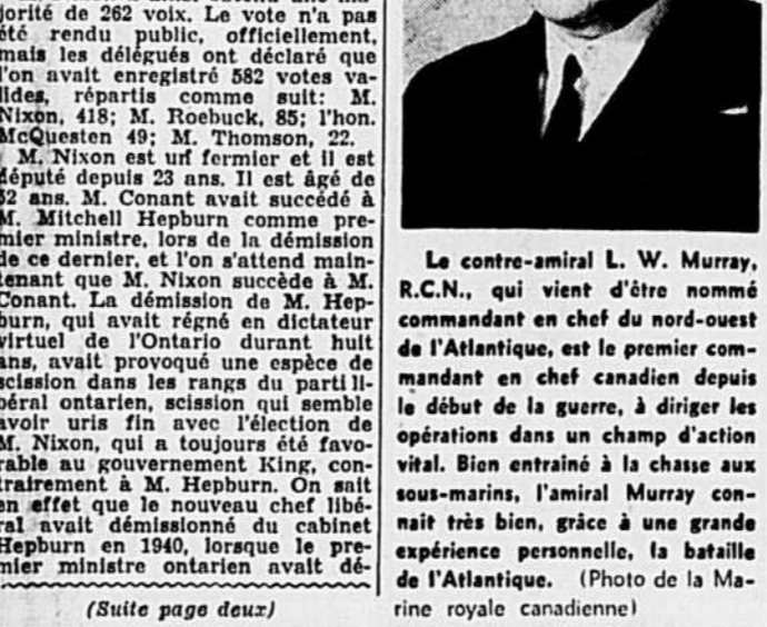
Une belle promotion R.C.N., qui vient d'être nommé commandant en chef du nord-ouest de l'Atlantique, est le premier commandant en chef canadien depuis le début de la guerre, à diriger les opérations dans un champ d'action vital. Bien entraîné à la chasse aux sous-marins, l'amiral Murray connaît très bien, grâce à une grande expérience personnelle, la bataille de l'Atlantique.