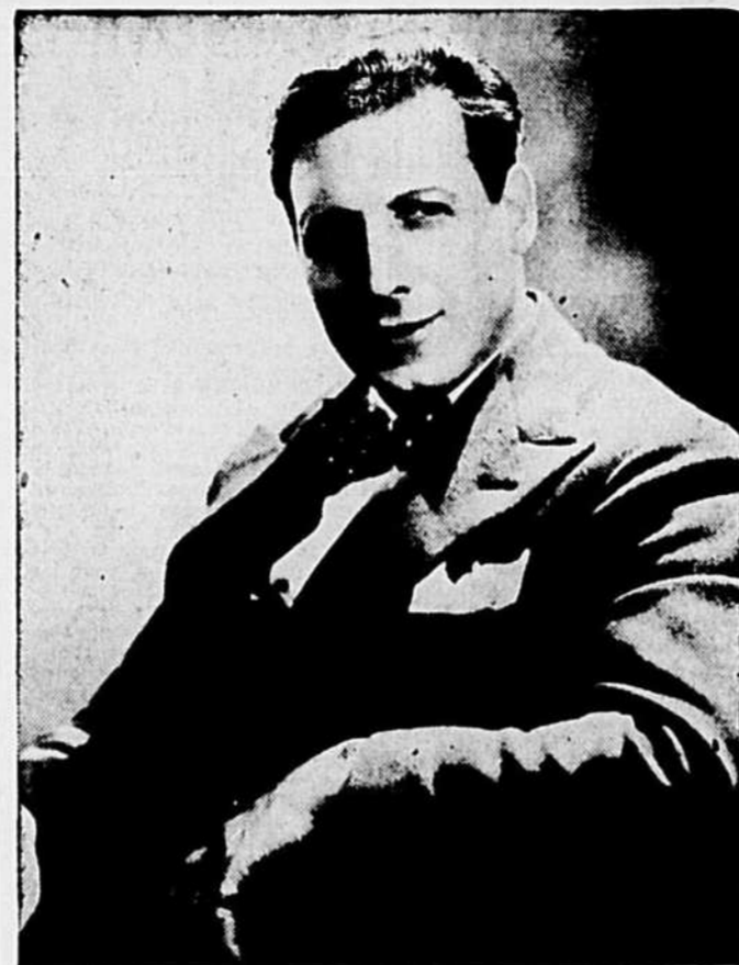
Ezio Pinza, célèbre basse du Metropolitan Opera House, qui est un des solistes au prochain Gala du Printemps des Concerts Symphoniques.

Reservation et vente des billets: Chez Ed. Archambault, 500, rue Ste-Catherine Est, Tél.: MA. 6201. Prix: $1.50, $1.20 et 90c. Taxe comprise.