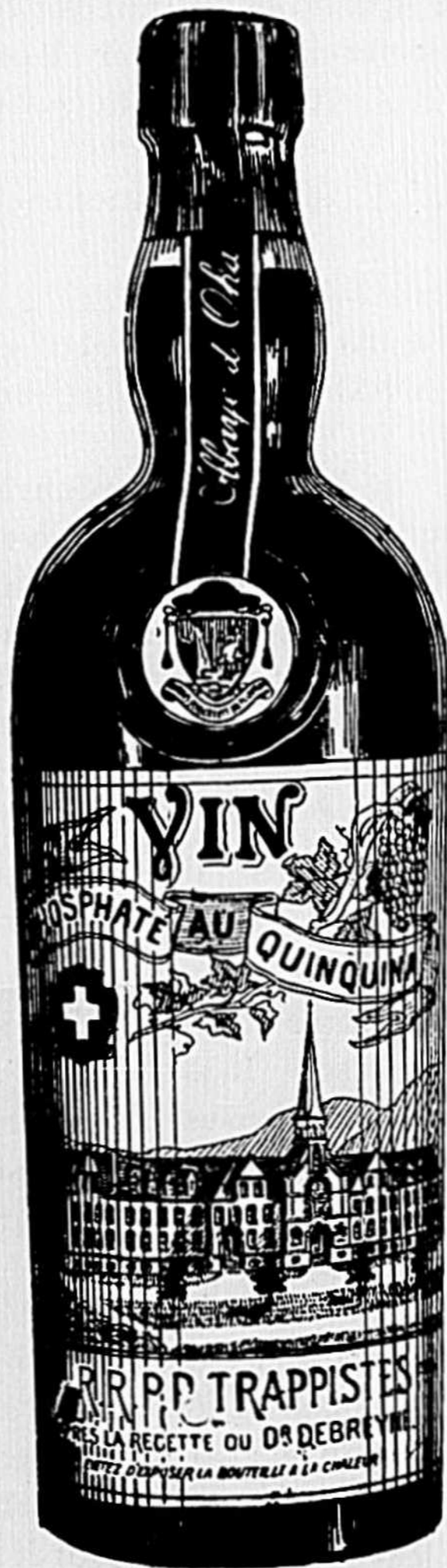
Ex re: bien et: étiq et: e to: sque vous a d'etez. C'e t: l: seul véritable.