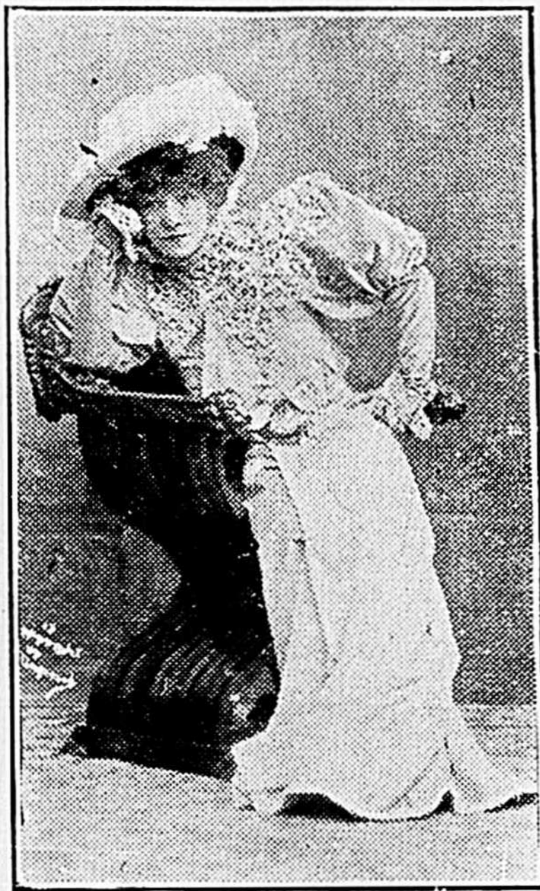
Madame Sarah Bernhardt