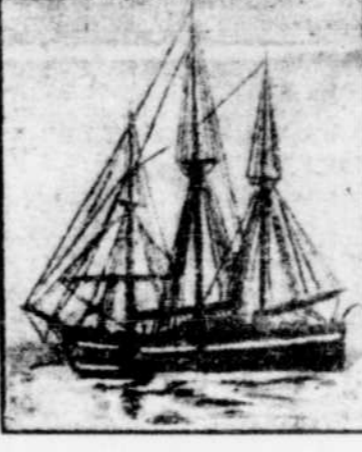
Le "Fram", navire qui a conduit dans les régions antarctiques l'expédition dirigée par le capitaine Roald Amundsen.

en qui elle avait placé sa confiance. Ce journal reconnaît que le capitaine Roald Amundsen était un explorateur d'une audace et d'une intelligence exceptionnelles. La femme du capitaine Scott a