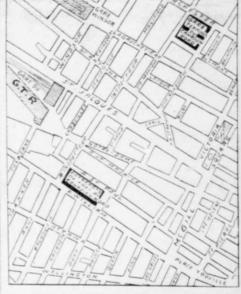
PLAN INDICANT L'EMPLACEMENT DE LA NOUVELLE GARE ET DES ENTREPÔTS DE FRET. LA LIGNE DE LA CÔTE DU PACIFIQUE. LES RENSEIGNEMENTS FOURNIS PAR SIR DONALD MANN.

Questionné sur les projets de la compagnie et sur ce qui touche les canotiers de l'Est, Sir Donald a déclaré que rien n'était encore décidé. Il ne faut pas se laisser aller à dire que l'intercolonial, mais il se contenta de dire: "Durant la dernière année de mon gouvernement, sir Wilfrid semblait désirer beaucoup nous faire prendre la ligne du gouvernement."