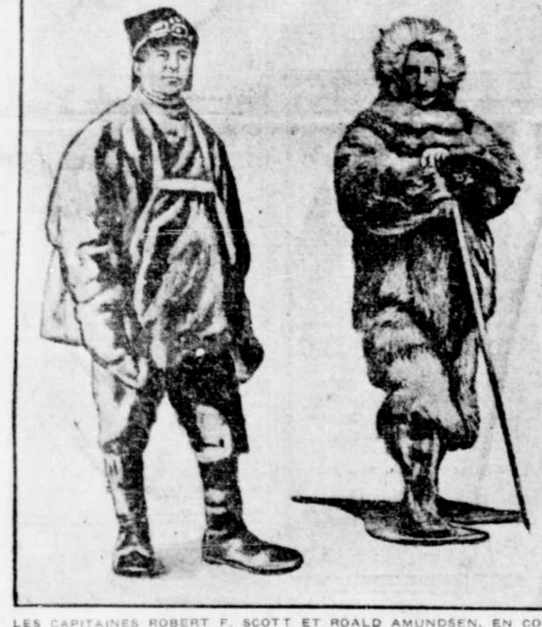
LES CAPITAINE ROBERT F. SCOTT ET ROALD AMUNDSEN, EN COSTUMES D'EXPLORATEURS. LE CAPITAINE SCOTT EST A GAUCHE DANS LA VIGNETTE.

1911, et que ce fameux explorateur a passé trois jours au sommet de la terre pour faire des observations. Le télégramme disant que le pôle sud a été atteint le 14 décembre 1911. Ce télégramme portait la signature du capitaine Roald Amundsen. A Londres, la nouvelle annonçant la découverte du pôle sud a été accueillie avec une certaine réserve. On n'a pas encore vu de nouvelles de la part de l'explorateur norvégien, mais on sait que les Norvégiens sont habitués aux difficultés des voyages polaires et qu'ils sont habitués à conduire les chiens et à marcher sur les glaces.