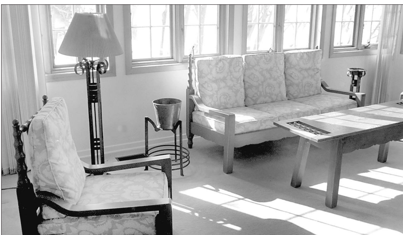
La Fondation de la Maison Paul-Émile Borduas a acquis du mobilier ayant appartenu à l'artiste grâce à un don de l'Association des fabricants de meubles du Québec. Ci-dessus, une pièce de la maison de Borduas à Mont-Saint-Hilaire.

Tout va encore mieux pour la mémoire de Paul-Émile Borduas. Hier matin, 45 ans presque jour pour jour après l'exil de Borduas à Paris où il allait mourir, la Fondation rendait publique l'acquisition du mobilier ayant appartenu à l'ar-