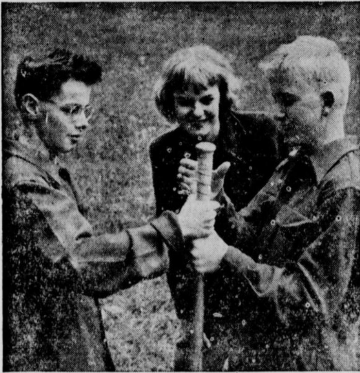
"MONTEZ" la photo à l'aide des accessoires appropriés

NOUS avons presque tous participé à l'organisation de théâtre amateur. Nous savons tous par conséquent que certains accessoires sont nécessaires pour camper les personnages et accentuer l'action. Ils contribuent à donner de la vivacité.