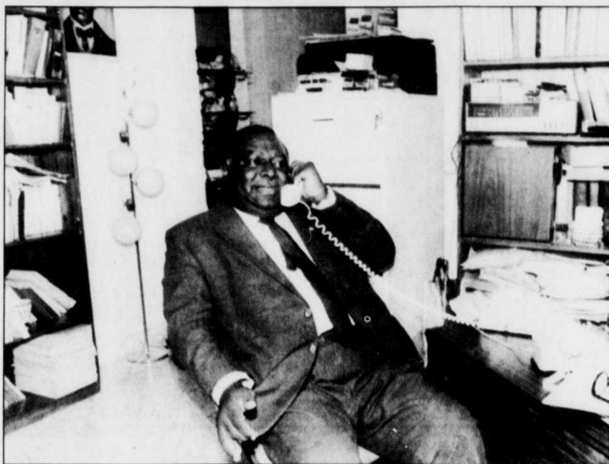
Le nouveau président de la République d'Haïti, M. Leslie F. Manigat à sa maison privée quelques heures après son élection.

«Essentiellement, il s'agit d'une prise de pouvoir moralement insoutenable, ont écrit les deux députés. Les Haïtiens se voient privés d'un droit pourtant inaliénable, celui de se gouverner».