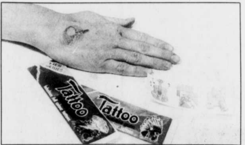
Les tatouages que les enfants peuvent trouver dans les sachets de gomme à mâcher sont tout à fait inoffensifs pour la santé. La SQ est formelle, les Blue stars n'existent pas au Québec.

de papier blanc, contenant des petites étoiles bleues imprégnées de LSD, de la grosseur d'une gomme à effacer de crayon, qu'on pouvait avaler ou imprimer sur la peau, ce qui permettait, grâce à l'eau, de faire passer l'acide par les pores, ce qui s'est avéré tout à fait faux, selon l'enquête de la GRC. On a dit aussi que les tatouages se présentaient sous la forme de timbres comme ceux de Superman et de Mickey, et sous l'aspect d'un papillon. Soulagé, le directeur de l'école Saint-André a fait savoir qu'aussitôt qu'il aura pris connaissance des documents de la Sûreté du Québec, il émettrait un second communiqué afin de rassurer les parents.