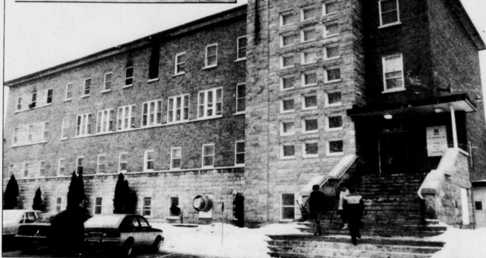
C'est au dortoir des hommes, situé au troisième étage du centre d'accueil Nor-Val que l'incendie a pris naissance. En médaillon, l'endroit où le foyer d'incendie se serait déclaré.