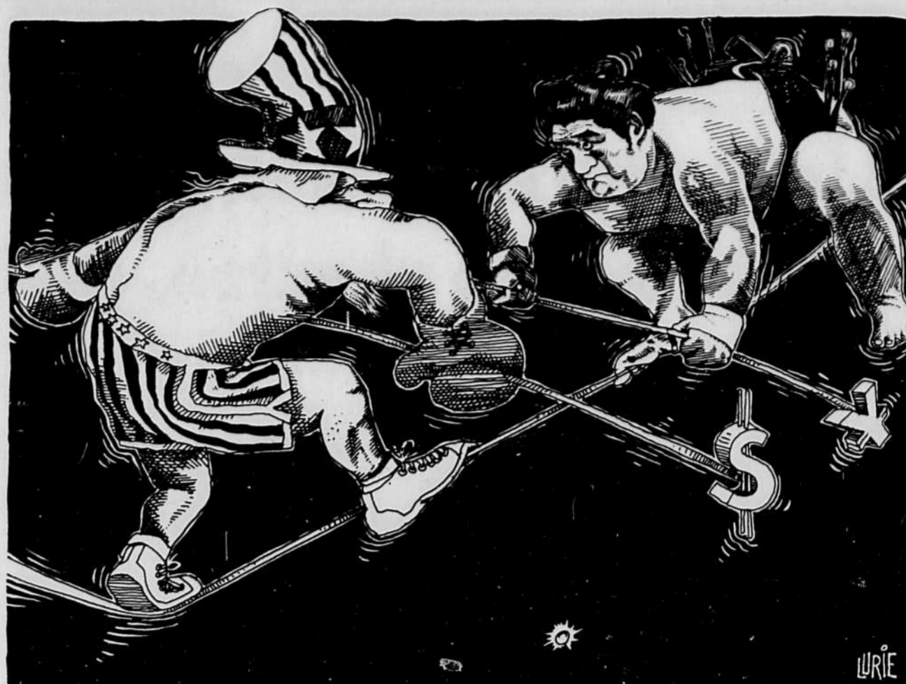
Question de balance commerciale...