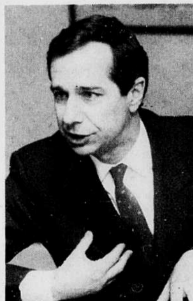
Le président du Conseil du Trésor Daniel Johnson