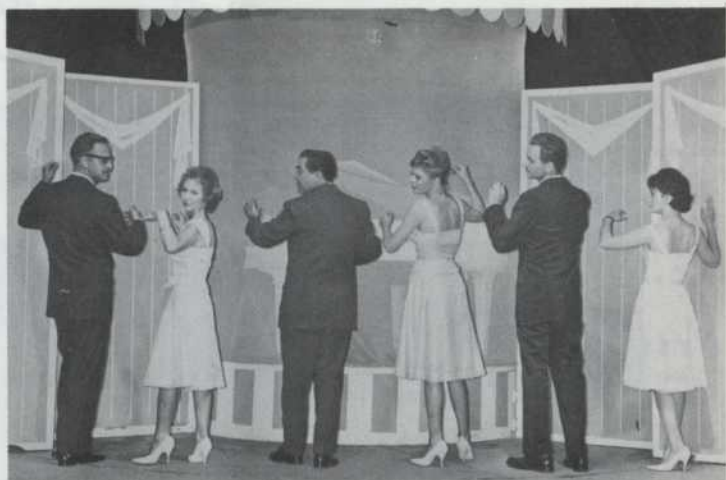
CAST OF THURBER CARNIVAL 1962