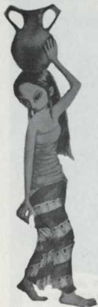
Pour Karaka, conte Indonésien Maquettes de Mirka Delanoé Les marionnettes de Guy Beauregard