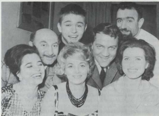
BUMERANG 1st GERMAN PRODUCTION OF 1963