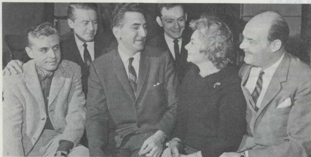
Les responsables de la saison artistique '64 Those responsible for the 1964 season

industrial design graphic design space planning/interior design