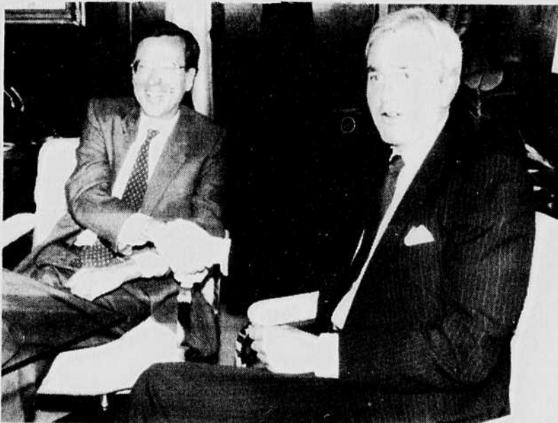
Les premiers ministres Robert Bourassa et David Peterson ont échangé une poignée de mains, hier, au terme d'une rencontre qui a surtout porté sur les relations économiques entre le Québec et l'Ontario.

Les deux premiers ministres ont révélé avoir notamment abordé la question des échanges d'électricité