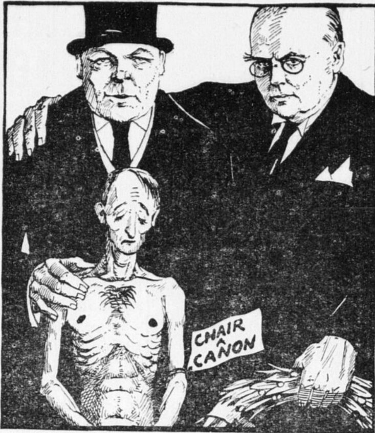
— Ohé, Canadiens. Il nous faut défendre la mère patrie. En avant pour la défense de "l'impair".

Vous savez d'ailleurs, monsieur le député, quelles manifestations triomphales les communistes ont organisées à travers tout le Canada pour célébrer la disparition de l'article 98 qu'ils réclamaient avec tant d'ardeur en ces dernières années. Ces manifestations ne