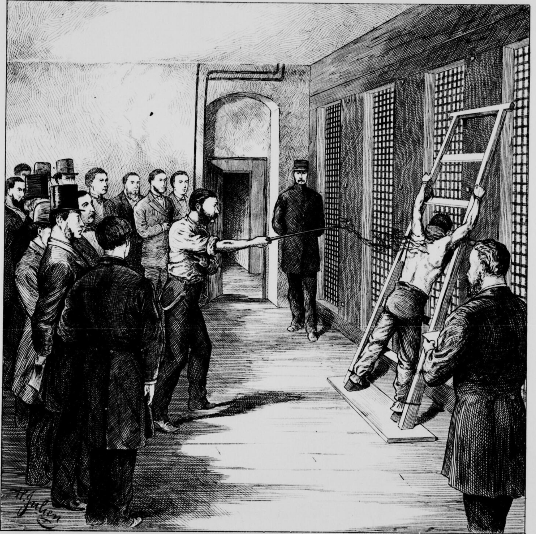
PEINE DU FOUET SUBIE PAR LE PRISONNIER CALABRIA