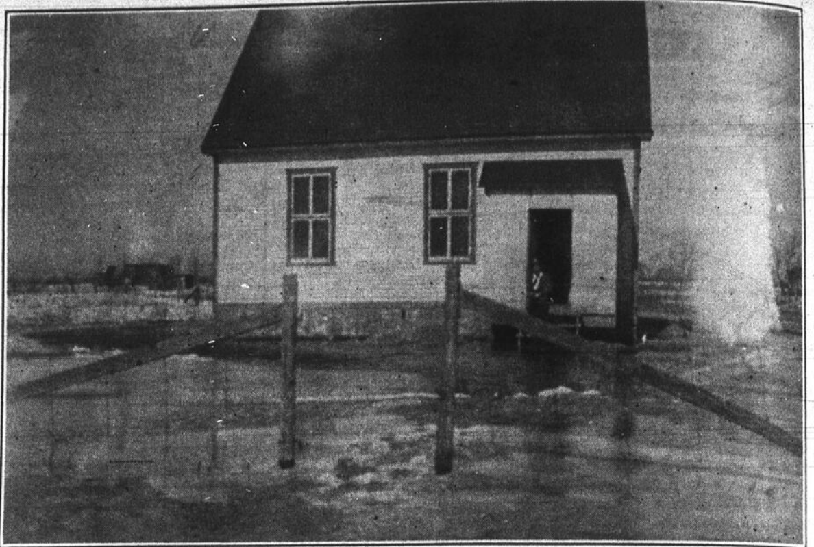
L'école No 8 à Notre-Dame du Sacré-Coeur, (St-Lambert-Annexe), 30 pieds par 30 pieds — inondée par un flot de plus de 100 élèves. Que fera la Commission Scolaire de la Paroisse de Laprairie à qui elle appartient?