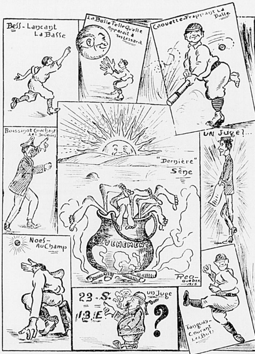
Compte-rendu imagé d'une partie de balle au camp (base-ball) jouée entre les employés du "Soleil" et de "L'Evènement" à Québec.—Dessin de notre collaborateur québécois Réo.

LES DESSINS OU CARICATURES DU "CANARD" SONT CHOISIS AVEC SOIN. VOYEZ-LES