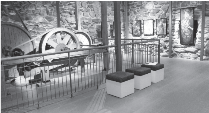
Un aperçu de l'exposition de Paule Genest à la Salle des courroies

contempler le travail d'une artiste québécoise reconnue pour ses scènes pittoresques et documentaires de la vie d'autrefois, Thérèse Sauvageau. Intitulée «Mémoire de village» cette exposition présentée à la Salle Pierre-Beaudoin offrira une remarquable sélection de toiles comme autant de portraits du mode de vie et des valeurs de nos ancêtres. Des photographies anciennes et une sélection d'objets apparentés seront aussi présentés dans le hall et la Salle des Courroies sous le titre «Témoins du passé», une exposition historique et thématique organisée en partenariat avec le comité des Fêtes du 150 e de Lac-Etchemin. «Mémoire de village» et «Témoins du passé» seront assortis d'un programme d'activités éducatives à l'attention des écoles et resteront en salle jusqu'au 17 décembre.