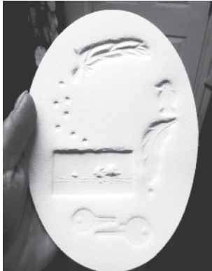
© Emmanuelle Breton, « Plumes de chaise aillée », avec clefs imprimées.

J'ai besoin de votre aide pour ramasser le plus de clefs possible dans le cadre d'une nouvelle œuvre que je souhaite créer.