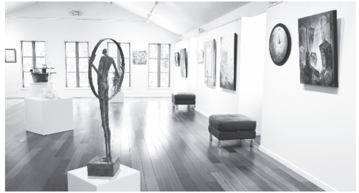
Un aperçu de l'exposition «Penser le temps»

À la Salle Pierre-Beaudoin, plus de 30 artistes participent à l'exposition-concours «Penser le temps» organisée pour souligner le 10 e anniversaire du Moulin. Le public découvrira une exposition éclectique qui présente un éventail de réponses originales à thème évocateur.