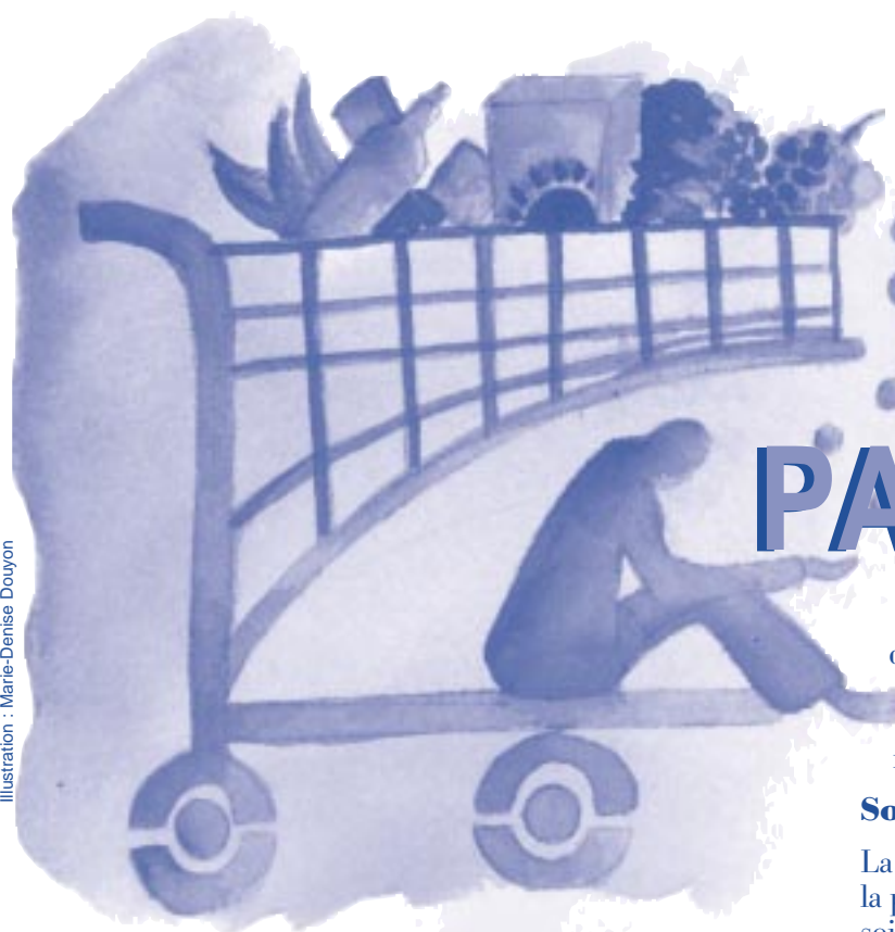
Illustration : Marie-Denise Douyon

● Association francophone ● Association internationale