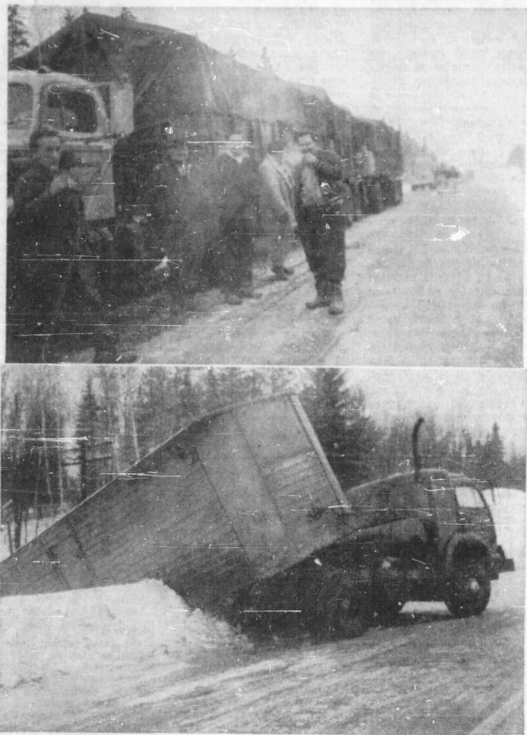
RETARD ET EMBOUTILLAGE — Le changement subit de la température hier a causé de nombreux retards et embouteillages sur les routes de la province. La livraison du journal "Le Droit" a été retardée de plusieurs heures à Sudbury et la région, ainsi qu'à Sturgeon Falls, par suite des mauvaises conditions de route entre Ottawa et le nord de la province. Dans la photo du haut nous voyons une lignée de plus de deux milles de camions de transport et d'autos immobilisés sur la route 17 près de Mattawa. Parmi les voitures immobilisées on remarque un camion de la Voirie qui devait épandre du sable sur la chaussée glacée. La photo du bas nous fait voir un lourd camion, qui n'a pu freiner, renversé dans le fossé.