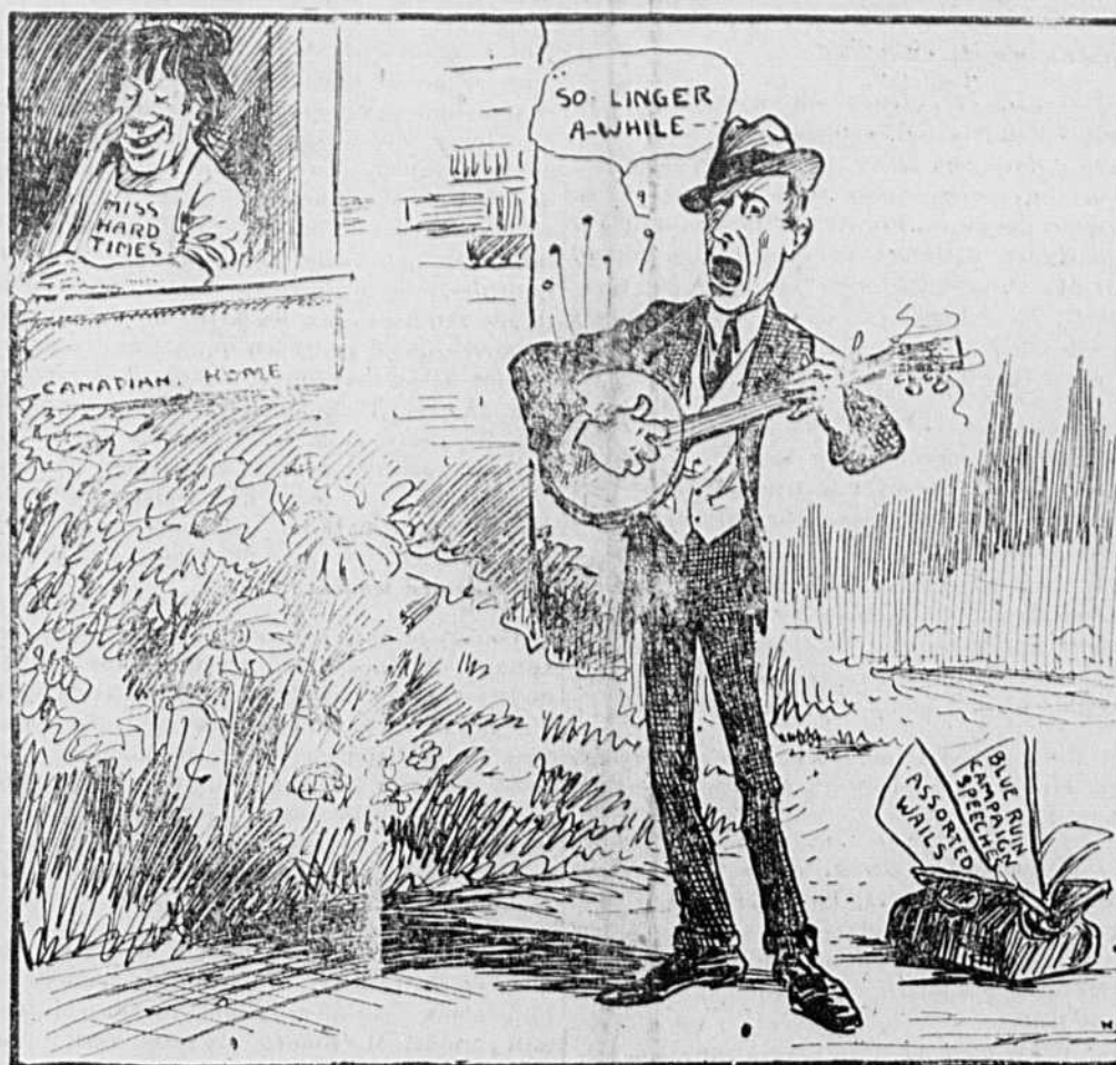
M. Meighen joue une sérénade à la misère, dans l'espoir de la voir sourire aux fenêtres du pays. (Caricature fournie au "Cri" par M. McConnell, de Toronto).

Je ne puis m'empêcher de voir dans ce passage une image de la gigantesque publicité que l'on fit, à l'époque des sacrifices insensés, autour de la nécessité