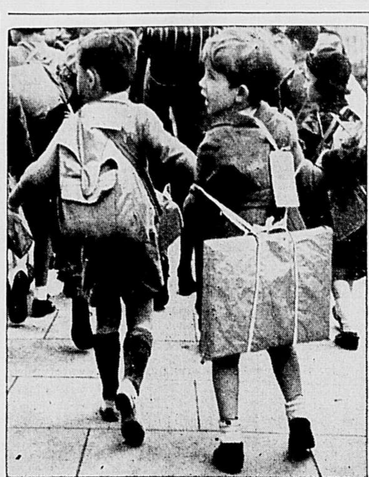
On entraîne ces petits enfants de Chelsea, en Angleterre, à s'évader vite de la ville lorsque les bombes sont lancées. Est-ce que ces enfants subiront des bombardements à l'avenir comme les enfants en Espagne en ont subi? Il faut agir de façon à éviter cette terreur.

Le Congrès condamna sans équivoque l'analgamation des chemins de fer.