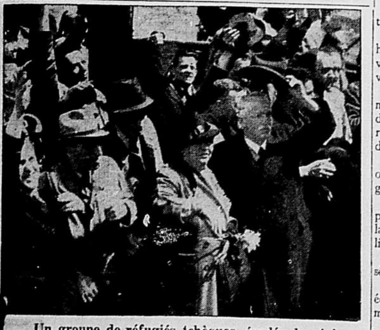
Un groupe de réfugiés tchèques, évadés du régime de la terreur hitlérienne, se montre ici avant de débarquer du paquebot polonais Sobieski à Douvres en Angleterre. Nous voyons Votja Benes, frère de l'ancien président de la Tchecoslovaquie, qui lève son chapeau, accompagné de sa femme.