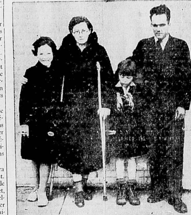
Mise dans la rue quand le mari privé de son magasin de confection par des procédés de saisies, cette famille est partie de Vancouver et a fait le voyage à Montréal à pied et à l'aide des automobilistes qui passent en route. Ces gens n'avaient que trois sous dans leur possession. La photo est prise à Regina. La mère souffre depuis quelques temps du genou.

Les uniformes sont faits le plus possible d'après le modèle des uniformes portés à Berlin.