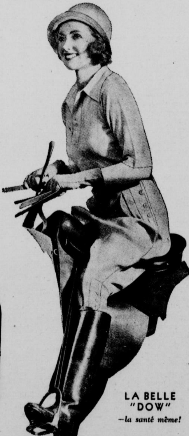
LA BELLE "DOW" — la santé même!