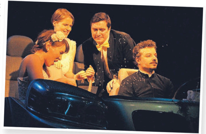
La pièce « Vague de fond » est présentée à 23 reprises cet été au Théâtre du Coq de Sainte-Perpétue.

Vingt-trois représentations sont à l'affiche