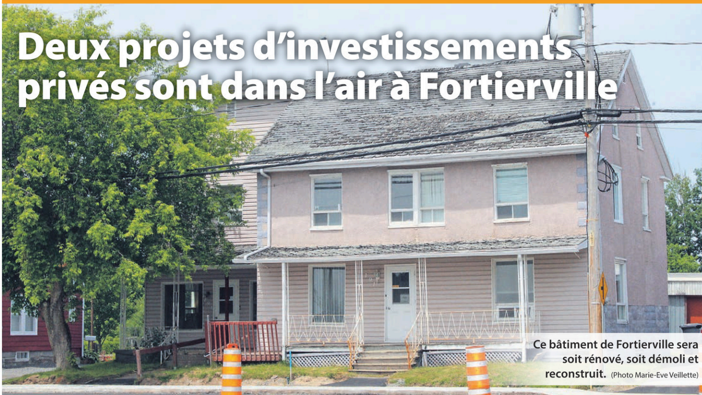
Ce bâtiment de Fortierville sera soit rénové, soit démolit et reconstruit.

MARIE-EVE VEILLETTE meveillette@icimedias.ca