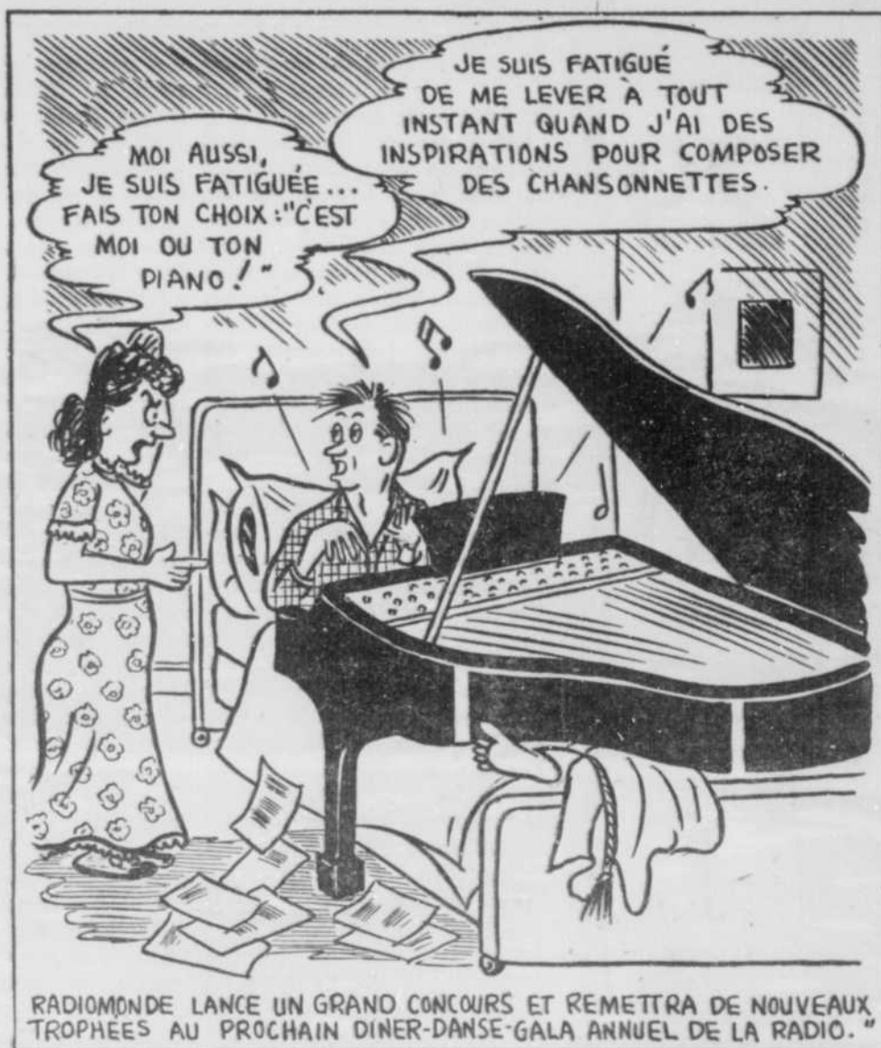
"RADIOMONDE LANCE UN GRAND CONCOURS ET REMETTRA DE NOUVEAUX TROPHÉES AU PROCHAIN DINER-DANSE-GALA ANNUEL DE LA RADIO."