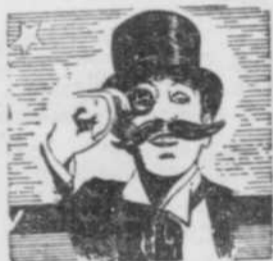
— PAR — L'ACADEMICIEN