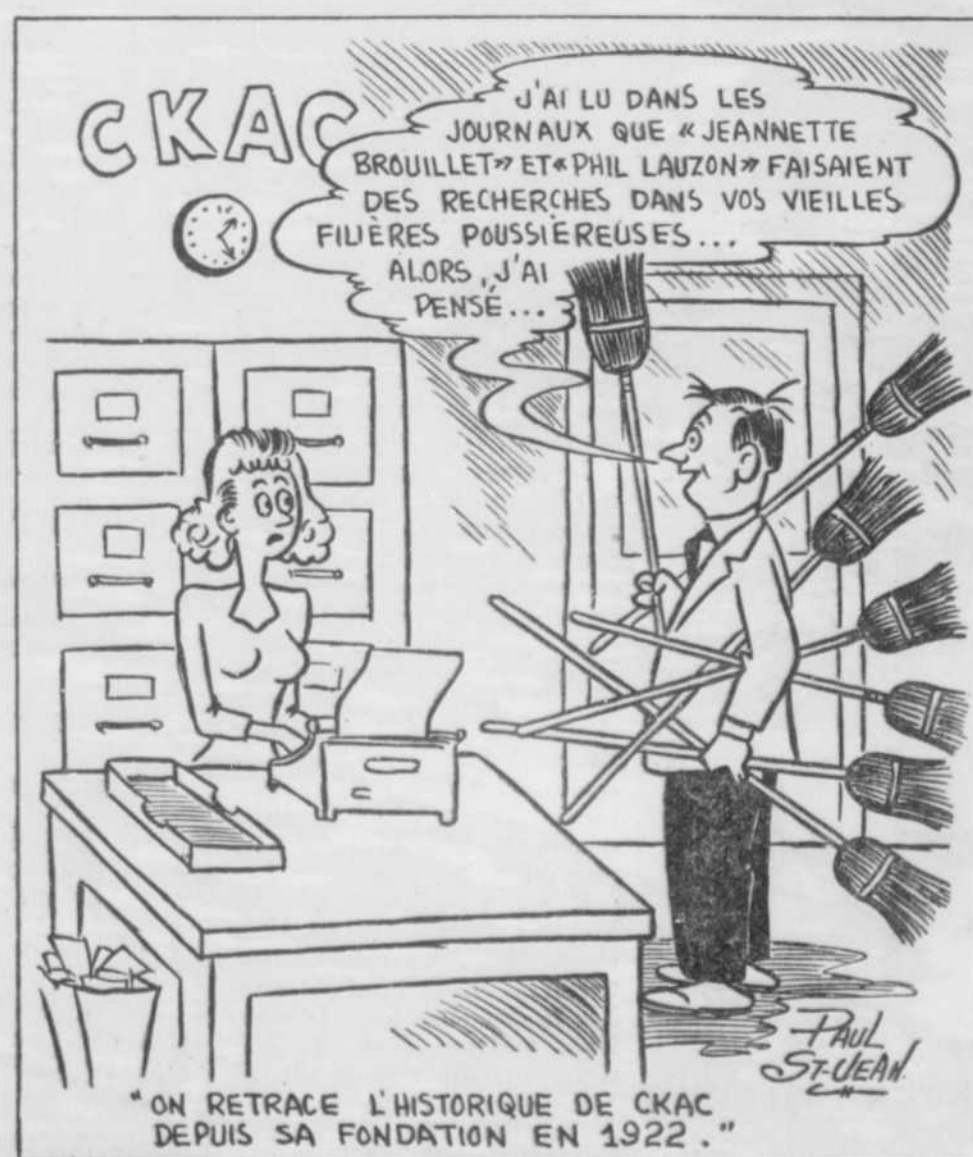
"ON RETRACE L'HISTORIQUE DE CKAC DEPUIS SA FONDATION EN 1922."