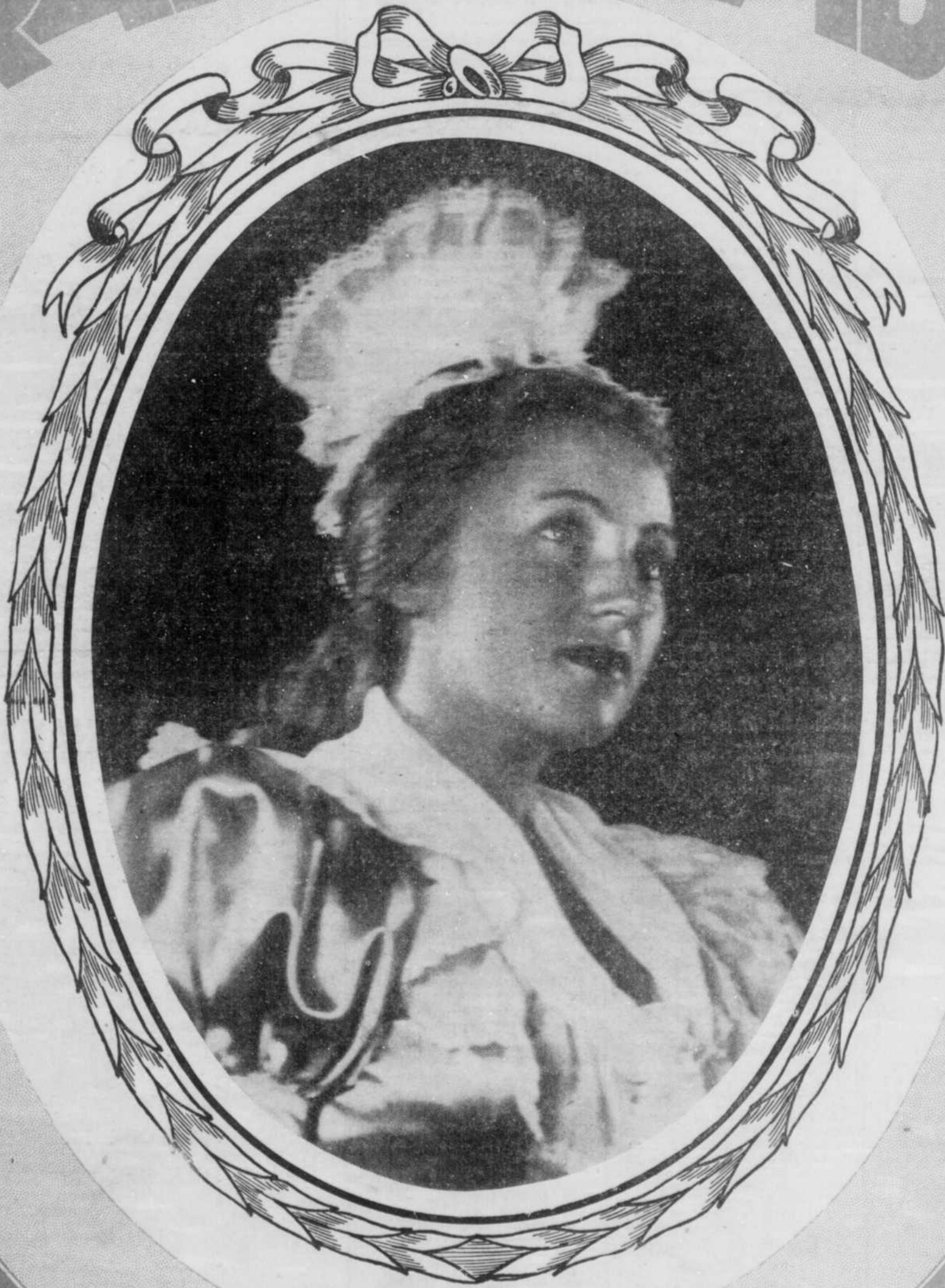
PIERRETTE ALARIE DANS "MIREILLE" AUX VARIETES LYRIQUES