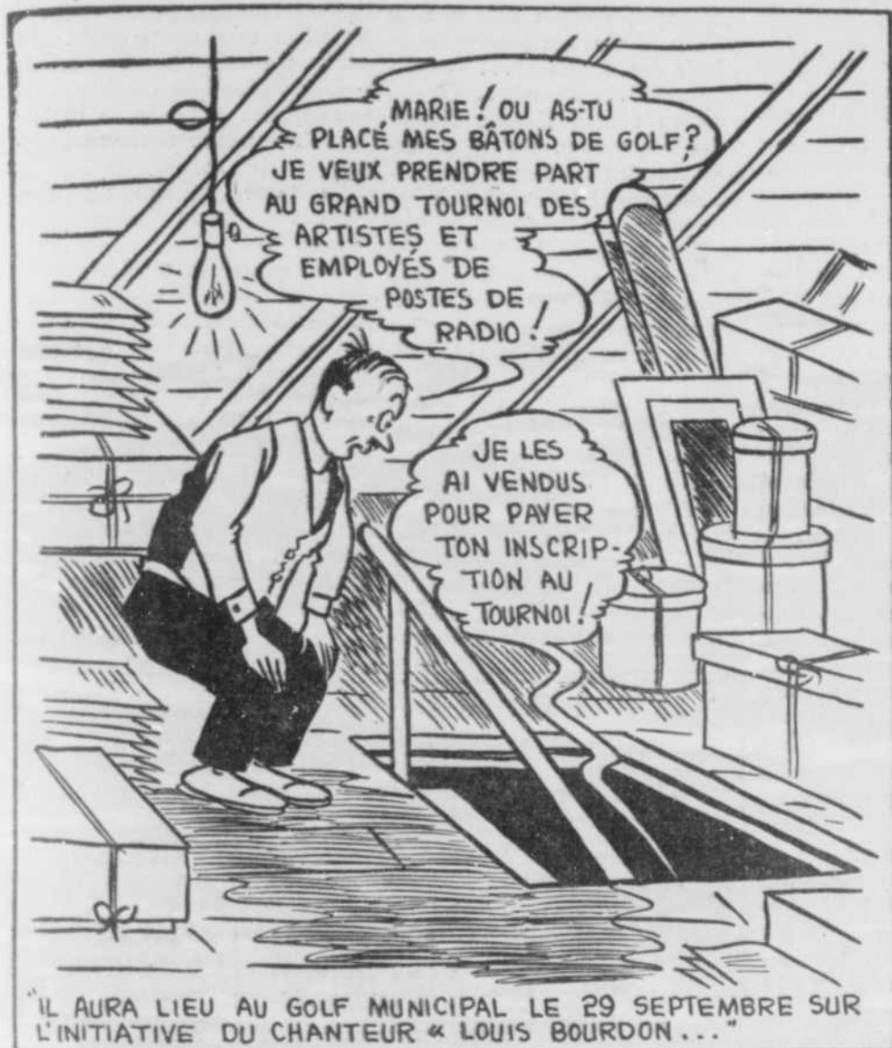
"IL AURA LIEU AU GOLF MUNICIPAL LE 29 SEPTEMBRE SUR L'INITIATIVE DU CHANTEUR « LOUIS BOURDON... »"