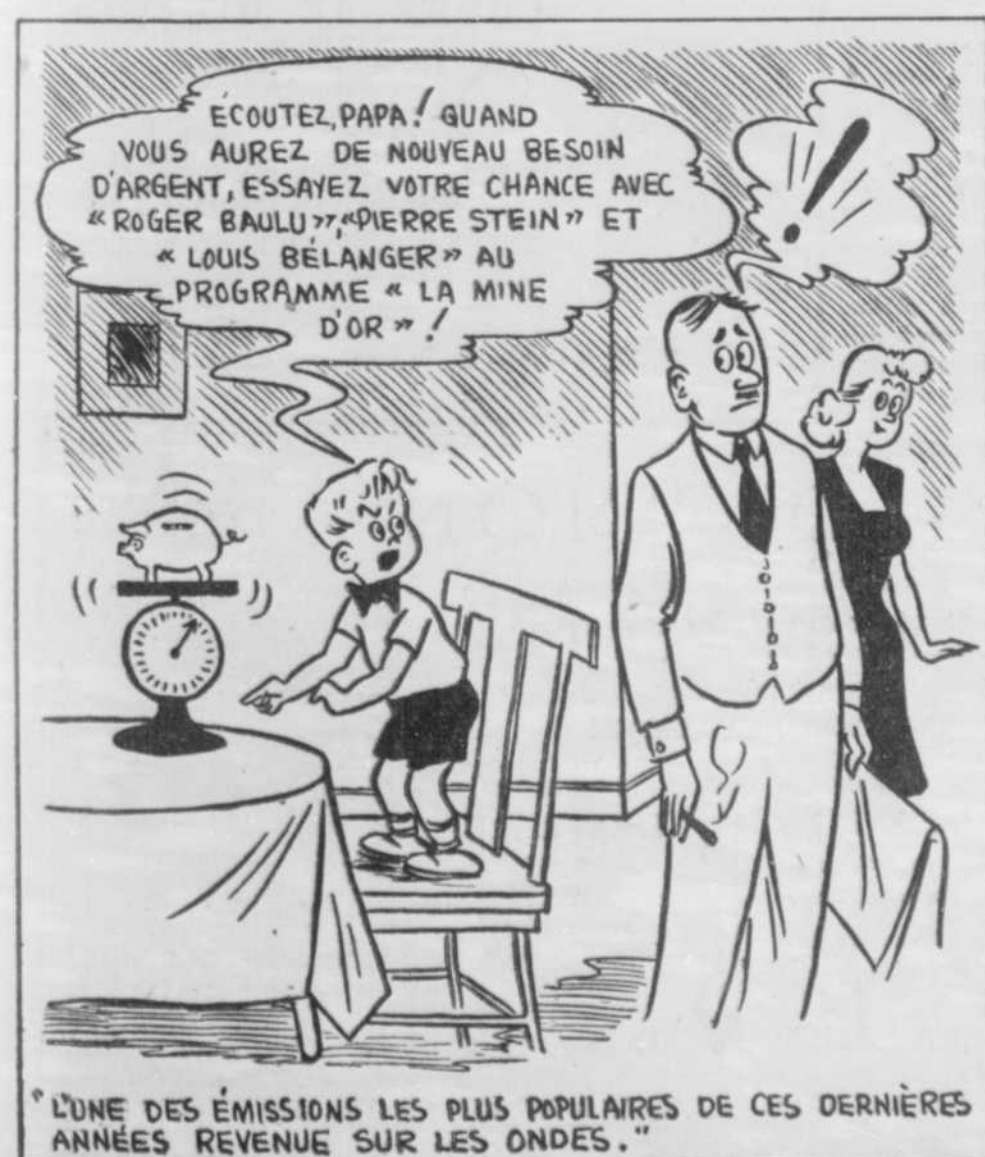
"L'UNE DES ÉMISSIONS LES PLUS POPULAIRES DE CES DERNIÈRES ANNÉES REVENU SUR LES ONDES."