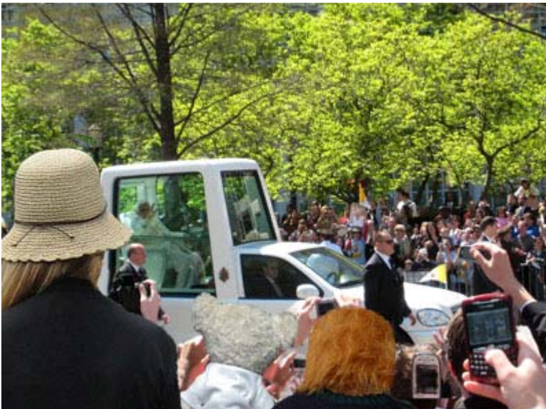
Mademoiselle X et les deux mascottes, Miss Gym et son frère Monsieur X, assistant à la visite de Benoit XVI à Washington aux États-Unis.