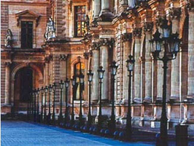
Musée du Louvre à Paris