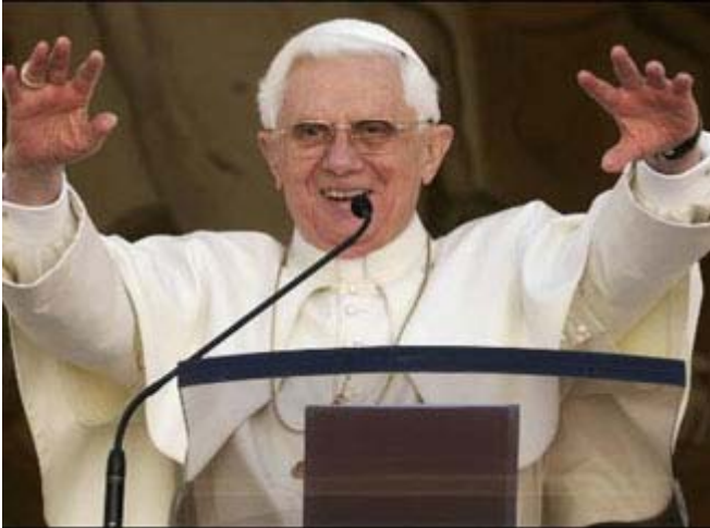
Pape Benoit XVI