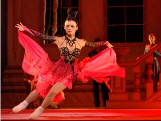
Artiste du spectacle

La troupe de patineurs sur glace "The Imperial Ice Stars" était récemment en spectacle à Montréal pour présenter une version moderne du ballet "Le Lac des cygnes". Leur prestation était digne des grands spectacles comme en font Disney ou le Cirque du Soleil, pour ne pas dire meilleurs! L'éditeur de LeStudio1.com s'était laissé convaincre d'assister à l'une des représentations par l'attachée de presse, Claudette Dionne, et il ne l'a pas regretté. "Ces artistes sont de véritables acrobates qui maîtrisent parfaitement l'art du patinage artistique et de la scène. C'est l'un des meilleurs spectacles que j'ai vu en 2008!"