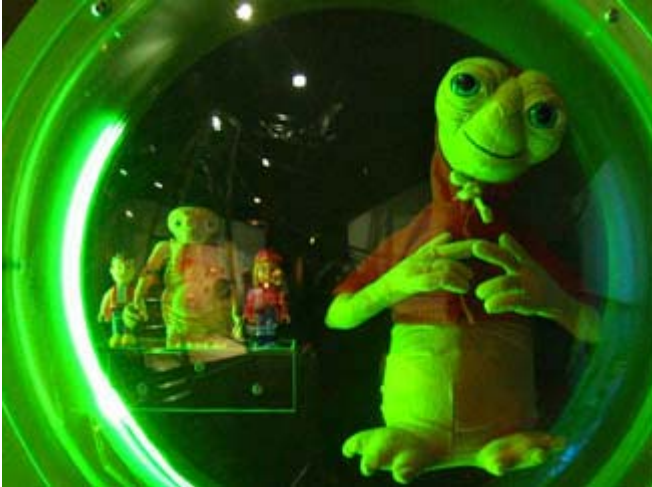
Personnage de l'exposition

Les extraterrestres envahissent le Vieux-Port de Montréal pour la saison estivale avec l'exposition "Extra ou terrestres" en montre au Centre des Sciences. Cette exposition est l'oeuvre du groupe international "The Science of" et a été présentée à Londres, Tokyo et Miami. En tout, il y a quatre grandes zones thématiques qui tracent un portrait du questionnement de l'humain face à ceux qui pourraient venir "d'ailleurs". Une présentation divertissante mais aussi éducative.