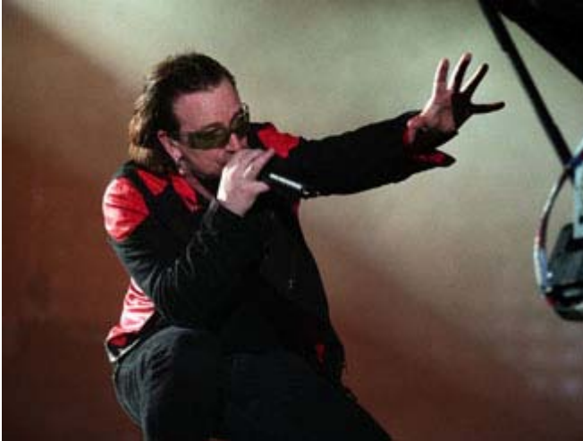
Le chanteur Bono de U2

L'éditeur de LeStudio1.com est un fan de U2 et de son chanteur Bono et il a voulu assister à la première du film Imax 3D présenté au cinéma du Centre des sciences de Montréal .