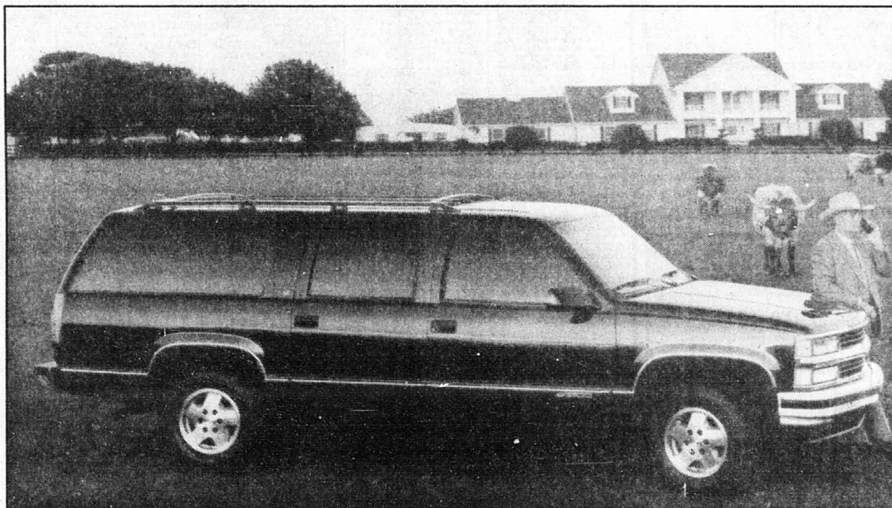
Lancé en 1935, le célèbre Suburban de General Motors a donc 60 ans.