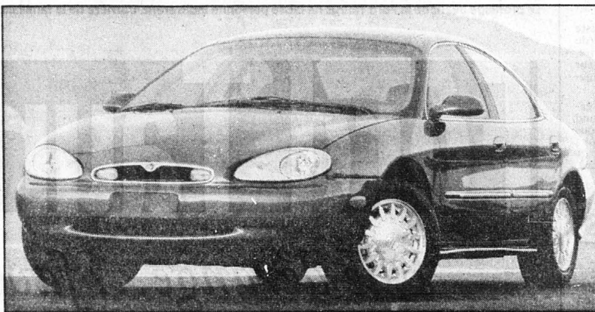
La Mercury Sable est identifiable à sa calandre chromée et ses feux de direction rapprochés.

Les principales nuances de style de la Sable viennent de ses feux arrière, plus fins, allongés, de ses phares davantage bridés et de sa calandre à bordure chromée qui recèle les feux de direction, passablement rapprochés l'un de l'autre.