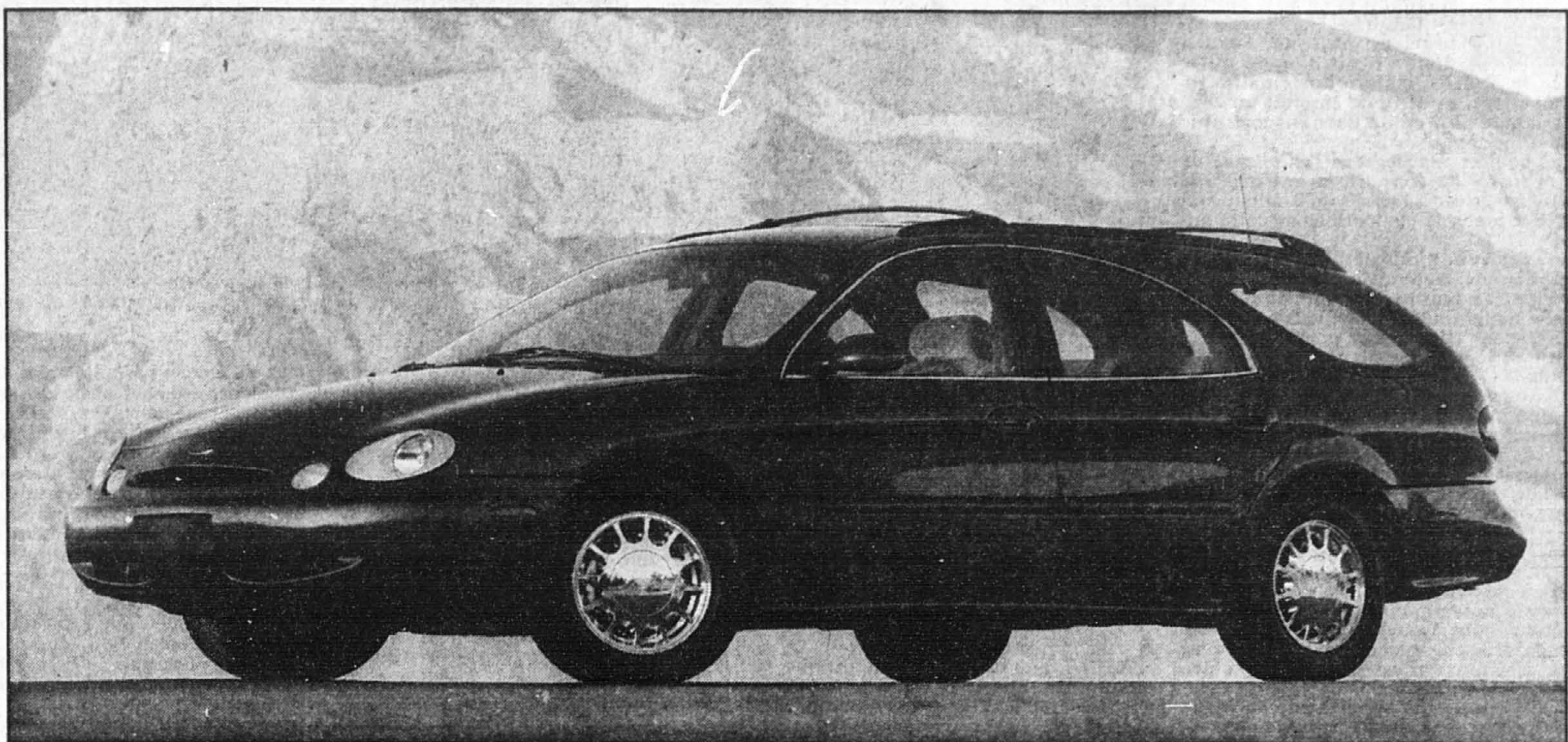
Le profilage avant de la Ford Taurus ne laisse personne indifférent. L'arrière de la familiale non plus, avec son hublot.