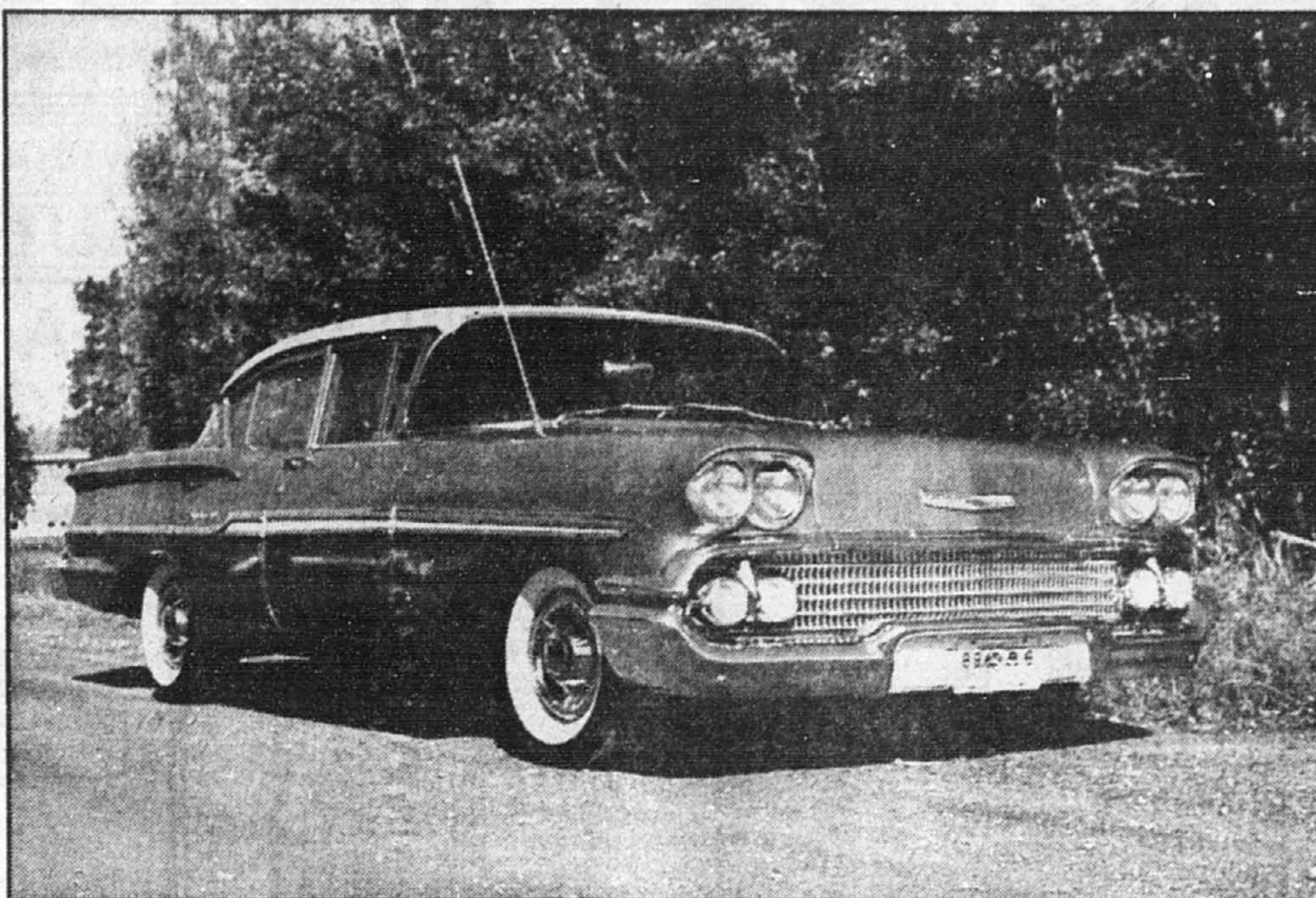
La Chevrolet Sedan quatre portes était la favorite des pères de famille en 1958.

C'est le genre de voiture que recherchait le père de famille. Le moteur de 235,5 pouces cubes (3860 cc),