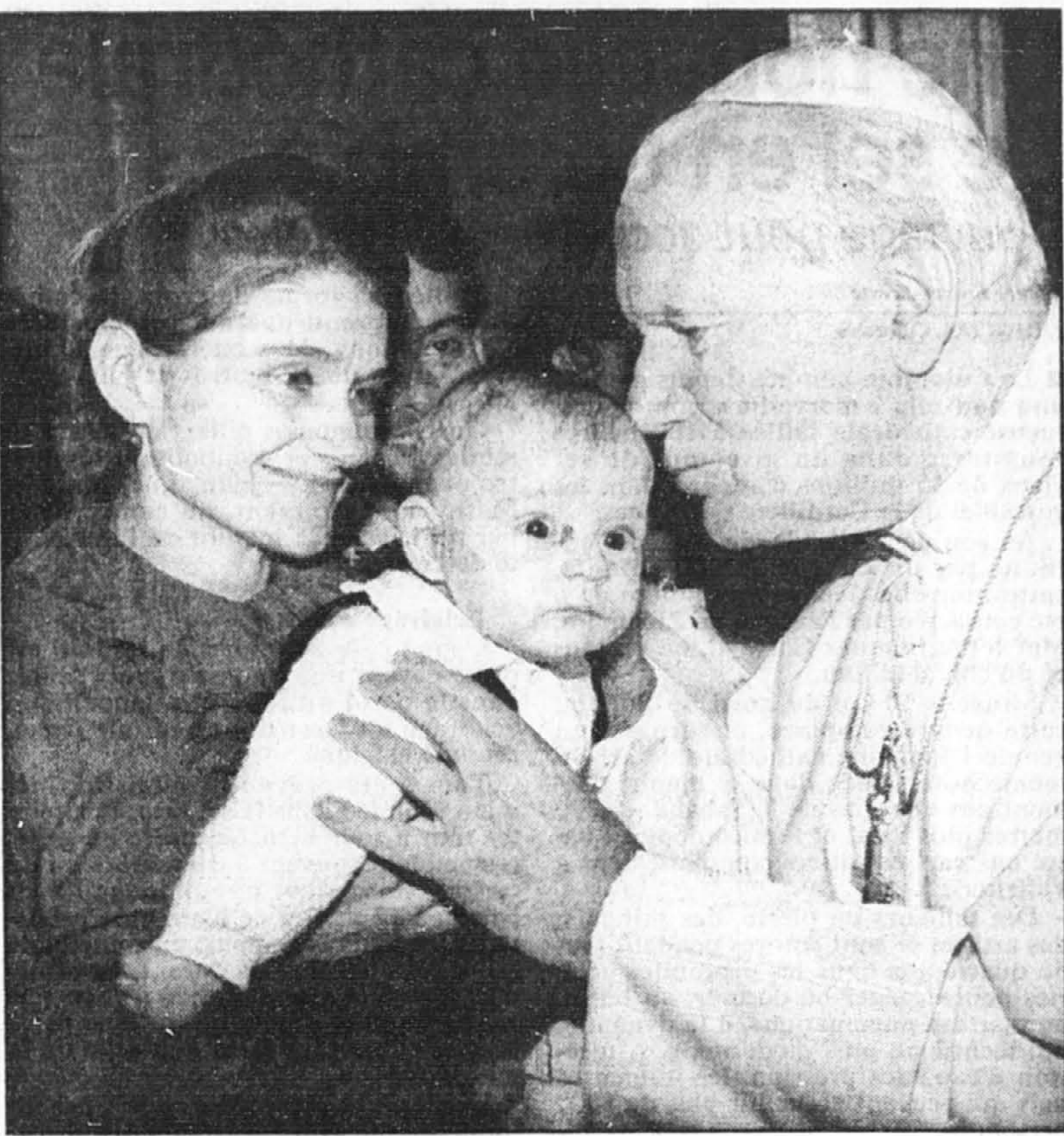
Le pape Jean-Paul II embrasse un enfant à son arrivée hier à une église du centre de Rome.