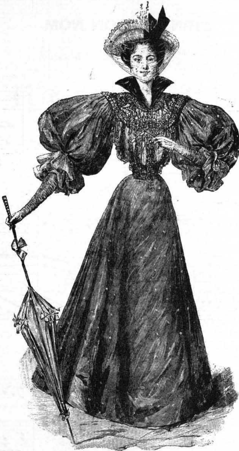
Toilette de printemps en crêpe à pois

La jupe, large du bas et à godets, c'est-à-dire telle qu'on porte toutes les jupes actuellement, est doublée de soie d'une nuance dont l'assortiment n'est pas sans importance. Mais cela est laissé au bon goût de l'élégante qui se servira du modèle. La jupe, dans le bas, a une cecelette d'aluminium et une bande de crin. Le corsage, sur double ajustée, s'agrafe au milieu ; le devant est bouffant et retombe sur la ceinture. On fait par derrière, quelques plis à la taille.