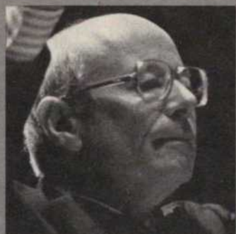
Direction: Mario Duschênes