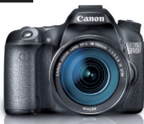
Ensemble Canon EOS 70D et objectif 18-135mm