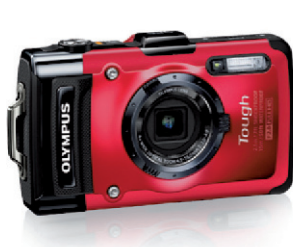
Olympus TG-2 iHS Étanche et antichoc