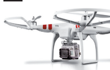
Quadricoptère DJI Phantom Faites voler votre GoPro (Caméra GoPro non incluse)