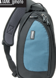
Sac Think Tank City Turnstyle 10 Pour les photographes urbains