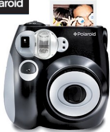
Polaroid 300 instantané