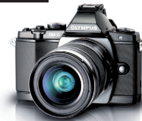
Ensemble Olympus OM-D E-M5 et objectif 12-50mm