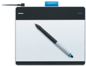
Tablette Intuos Pen & Touch Exprimez-vous, naturellement.