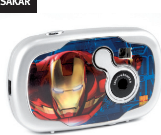
Appareil photo pour enfant Iron man, Cendrillon, Cars, Spiderman