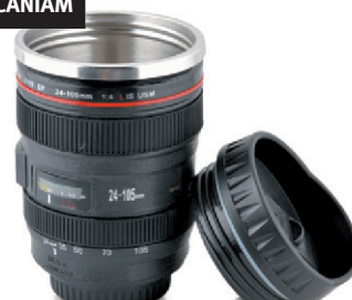
Tasse Caniam Forme d'objectif 24-105mm