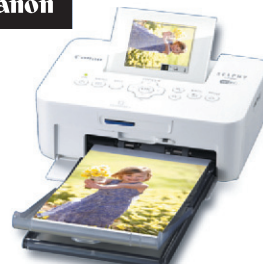
Imprimante Canon CP 900 Blanche, format 4x6, WiFi,