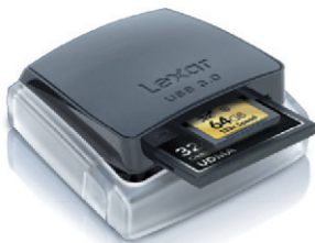
Lecteur et carte mémoire LEXAR Performance exceptionnelle