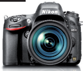
Ensemble Nikon D610 et objectif 24-85mm