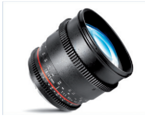
Obj. Rokinon 85mm T1.5 CINE Pour monture Canon