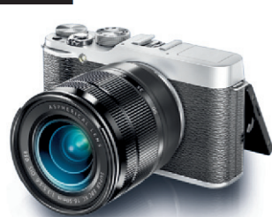
Fujifilm X-M1 et obj. 16-50mm Partage et créativité sans fil