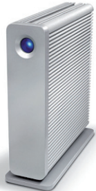
LaCie d2 Quadra USB 3.0 3To Rapide et fiable