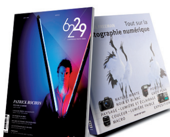
Grand choix de livres et magazines spécialisés sur la photo et vidéo