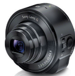
DSC-QX10 Pour téléphone intelligent