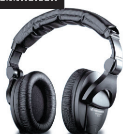
Casque Sennheiser HD280 Pro Casque professionnel fermé