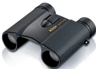
Jumelles 8x25 D CF Sportstar EX Étanches et résistantes