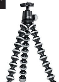
Trépied GorillaPod SLR-Zoom Installation polyvalente